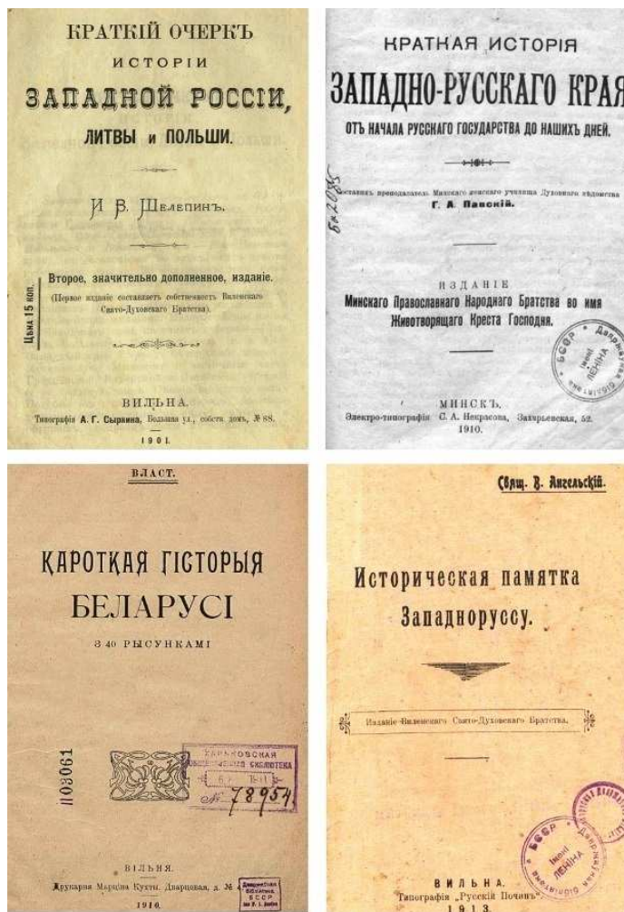
Беларуская вучэбна-гістарычная літаратура (пачатак ХХ ст.)