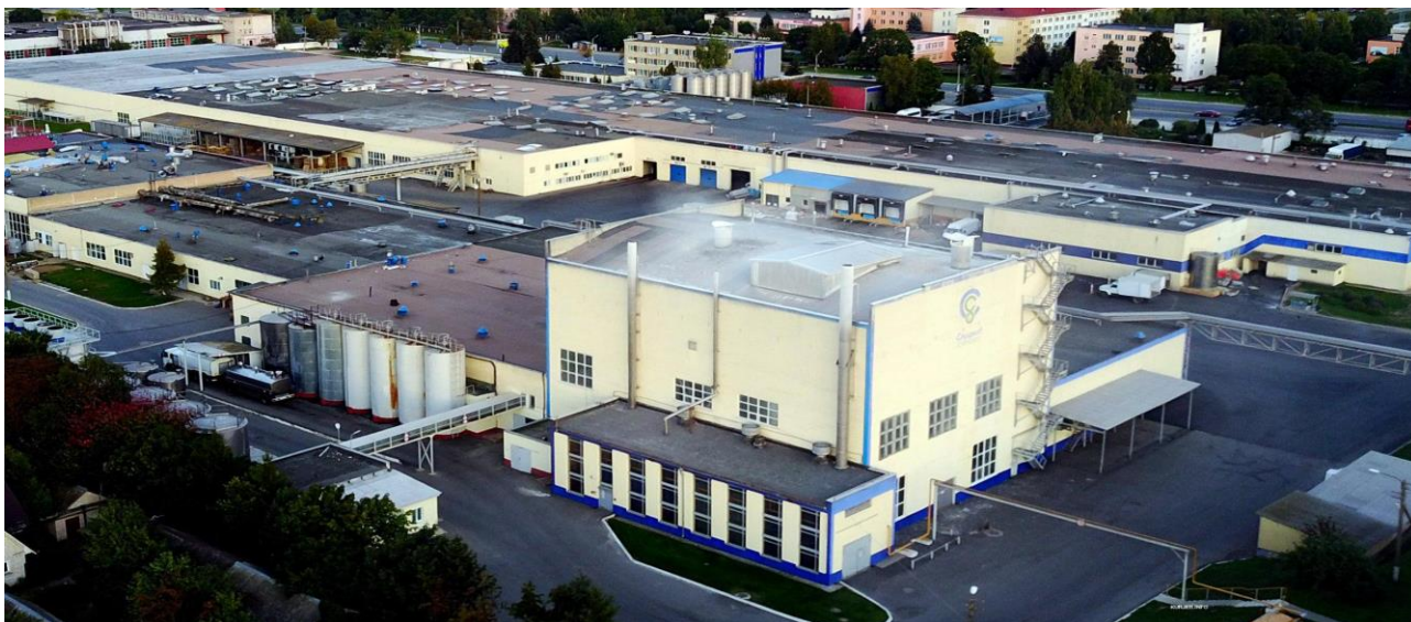
Рисунок 1. – Слуцкий сыродельный комбинат, Беларусь

Достаточно успешно развивается принцип безотходного производства в лесной и деревообрабатывающей отраслях, в энергетике. В республике построено более 20 мини-ТЭЦ, которые работают на возобновляемом топливе – древесине и ее отходах, а также могут использовать фрезерный торф и проч. (Петриковская, Речицкая, Лунинецкая, Пружанская мини-ТЭЦ) (рисунок 2).