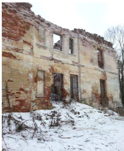
Рисунок 4. – Разрушение наружной стены торцевой части здания

В результате осмотра руин выявлено, что крыша и перекрытия полностью отсутствуют. Сохранились наружные и частично внутренние стены. Причем наружные стены имеют серьезные повреждения