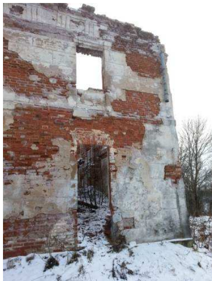
Рисунок 5. – Фрагмент северного фасада усадьбы Гребницких

Стеновая поверхность цокольного этажа выступает на четверть кирпича, толщина его стен 90 см. На южном фасаде цокольные оконные проемы шириной 120 см с перемычками в виде сегментной (лучковой) арки имеют скошенные боковые откосы. Как уже отмечалось выше, колоннада южного портика опирается на массивный цокольный постамент размером в плане 2,5 \times 11,3 м и высотой 2,2 м с тремя арочными проходами в выступающей части, шириной по 190 см и высотой 170 см (рис. 6).