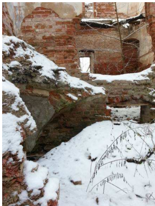
Рисунок 7. – Цокольный этаж

На восточном и западном торцах здания в уровне цокольного этажа имеется по одному окну с клинчатыми перемычками. На уровне цокольного этажа в середине восточного фасада, где в соответствии с планом первого этажа показано наличие запасного выхода, обнаружены остатки кирпичной кладки и арочный проем, заложённый кирпичом. Со стороны западного фасада на уровне первого этажа около дверного проема сохранились остатки разрушенного крыльца.