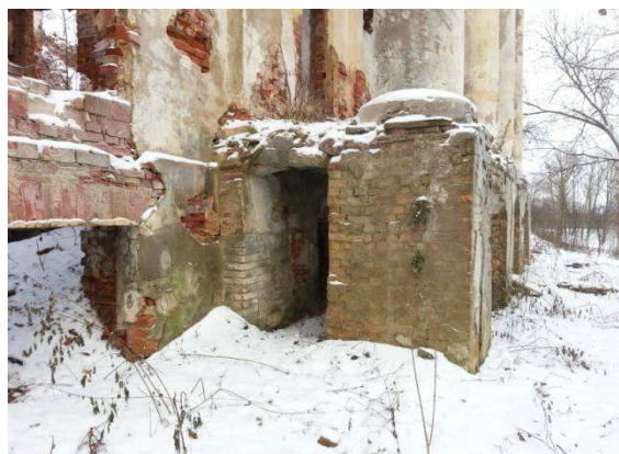
Рисунок 6. – Цокольная часть террасы

В уровне цоколя под террасой имеется сквозной продольный проход шириной 85 см, из которого через дверной проем можно попасть в цокольный этаж.