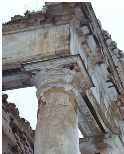
Рисунок 2. – Капитель угловой колонны

Выявлено использование оригинального, не свойственного тому времени способа возведения здания на склоне достаточно крутого рельефа с перепадом высот около 2 м. Это позволило архитектору организовать удобный подъезд и главный вход в здание на уровне первого этажа с северной стороны, что обеспечивало функциональную и композиционную связь цокольного этажа с огородом и садом, расположенными с южной стороны. Ориентация окон здания по сторонам света в 50 градусов обеспечивала достаточную инсоляцию как южного, так и северного фасадов.