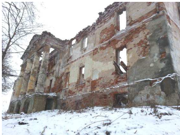
Рисунок 3. – Южный фасад усадьбы Гребницких

треугольного фронтона также имеет выступающие дентикулы, расположенные с тем же шагом, что и на карнизе антаблемента. На плоскостях наружных стен северного и южного фасадов, сообразно колоннам имеются пилястры шириной 75 см.