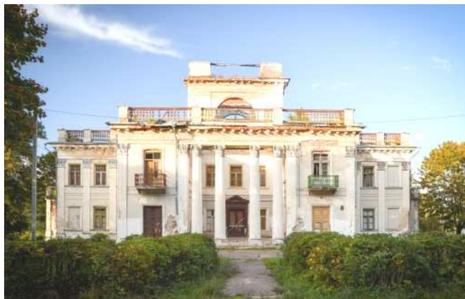
Рисунок 3. – Усадьба Умястовских в наши дни

Усадьба Умястовских в наши дни представлена на рисунке 3. Это Т-образное в плане (рис. 4) двухэтажное симметричное здание в стиле классицизма.