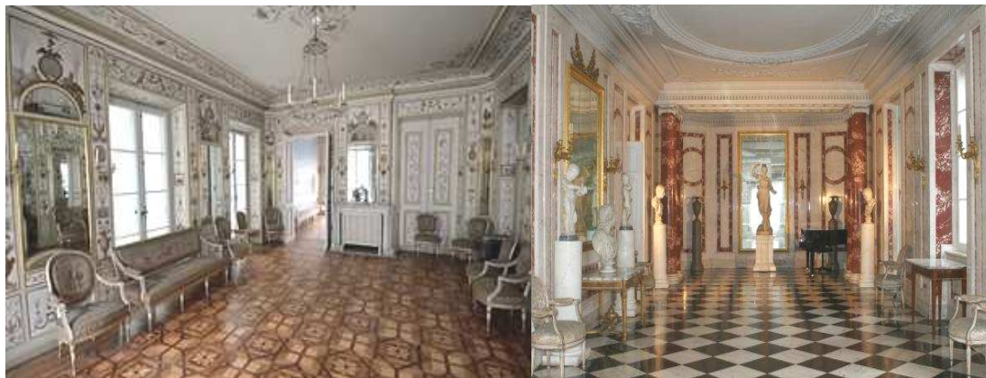
Рисунок 8. – Интерьер дворца в наши дни

Мебель и картины во дворце выдержаны в классическом стиле. Над зданием доминирует аттик, поддерживаемый колоннами и украшенный статуями мифологических персонажей (рис. 8).