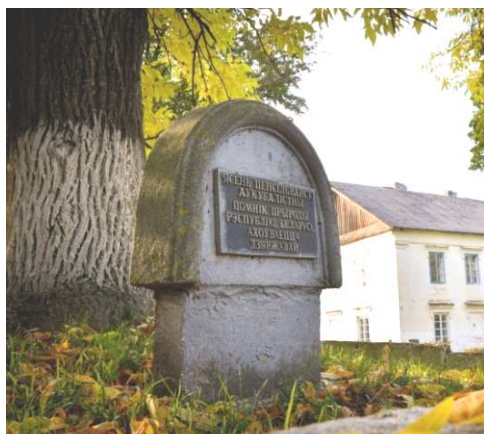
Рисунок 5. – Редкое дерево ясень Пенсильванский

Парадный двор был устроен в виде круглого партера с декоративно подстриженным газоном и кустарниками. Также на территории усадьбы располагались экземпляры редких деревьев. Например, ясень Пенсильванский (рис. 5), который сохранился до наших дней как памятник живой природы.