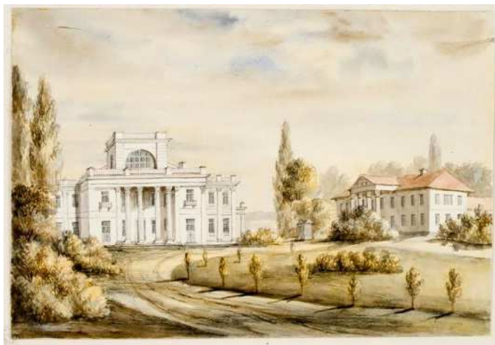
Рисунок 1. – Усадьба Умястовских (1875 г.)