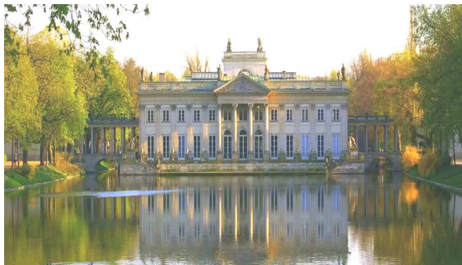
Рисунок 2. – Дворец «Лазенки» в Варшаве

даря этому в удаленных местах Беларуси, Украины и Литвы стали возводиться копии королевских резиденций Польши.