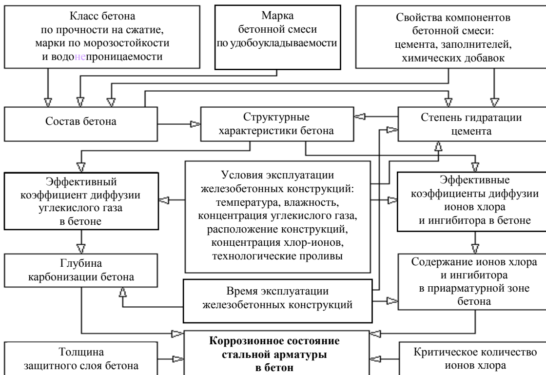
Рисунок 1. – Схема прогнозирования коррозионного состояния стальной арматуры железобетонных конструкций

Структурная схема расчетов проиллюстрирована на рисунке 1. Она представляет собой симбиоз «технологических» и «эксплуатационных» влияющих факторов.