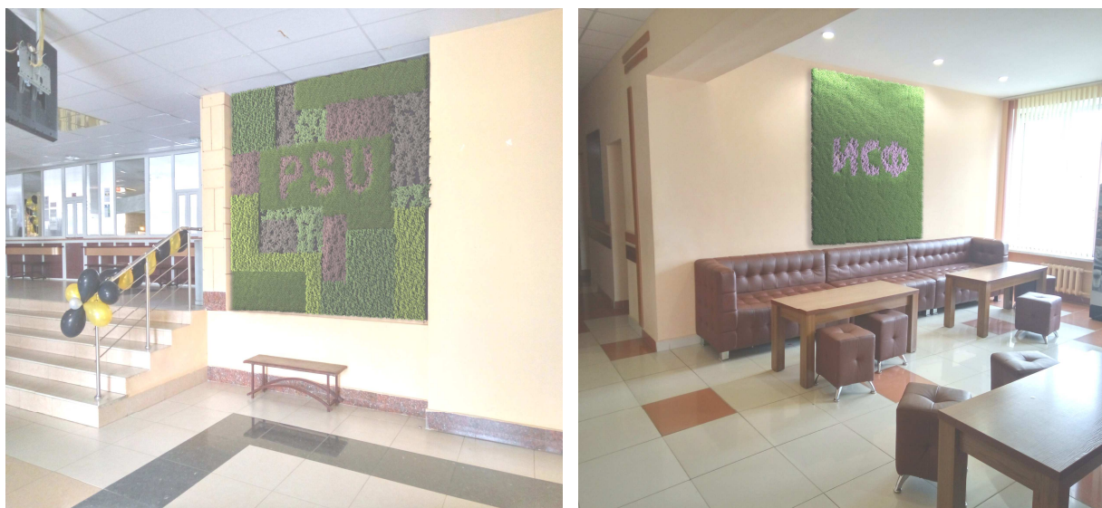
Рисунок 7. – Проект вертикального озеленения интерьеров главного корпуса Полоцкого государственного университета

Также разработаны два предложения по внедрению вертикального озеленения в интерьеры главного корпуса Полоцкого государственного университета: перегородка фойе первого этажа и стена рекреации для отдыха третьего этажа инженерно-строительного корпуса (рисунок 7). Предполагаемые размеры фитомодулей 2,5×2,3 м, 1,8×1 м. С учетом максимальной требуемой высоты поднятия жидкости 2,3 м (высота модуля в фойе), рассчитывали требуемый диаметр веревки исходя из положения: высота подъема воды в капилляре гигроскопичного материала не зависит от давления атмосферы и обратно пропорциональна радиусу капилляра [10]. Питательный раствор изготавливали с жидким удобрением «Мир цветов», плотность 1041 кг/м 3 , поверхностное натяжение раствора 63,6 мН/м. Расчетный радиус веревки составил 0,00542 м, принимали требуемый диаметр веревки 10 мм.