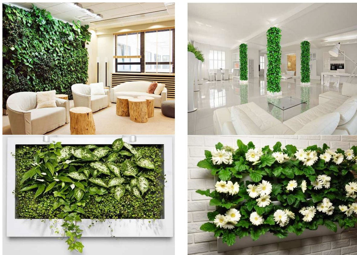
Рисунок 2. – Фитостена, фитоколонна, фитокартина, фитомодуль для вертикального озеленения поверхностей помещения