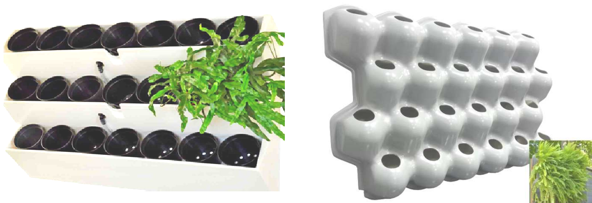
Рисунок 3. – Полихлорвиниловые фитомодули горшечной и цельной системы

Фитомодули для выращивания растений в почве горшечной либо цельной системы. Модули можно крепить к вертикальной поверхности или устанавливать в интерьере как элемент декора, создавая вертикальное озеленение различных форм и очертаний (рисунок 3).