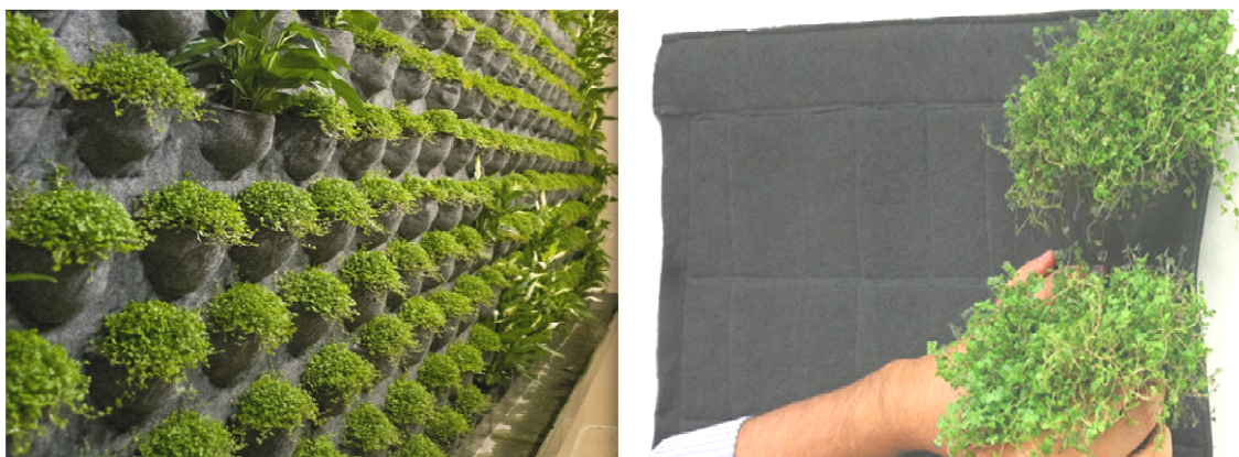
Рисунок 4. – Фитомодули на войлочной основе с карманами, прорезями

Фитомодули для выращивания растений без почвы и субстрата способом гидропоники, впервые примененным в вертикальном озеленении архитектором Патриком Бланком [7]. В качестве основы для выращивания растений использован полимерный войлок с микрокапиллярной структурой, проводящий питательный раствор от системы полива. Фитомодуль состоит из стального каркаса, который можно крепить к поверхности или устанавливать в любом месте интерьера. К каркасу крепят гидроизоляционный листовый материал и 2 слоя синтетического войлока. Побеги или сформировавшиеся растения высаживают в верхний слой войлока в разрезы или кармашки (рисунок 4).