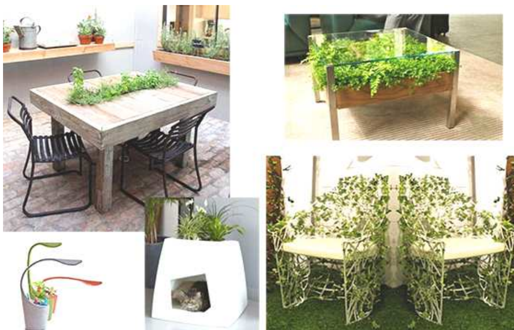
Рисунок 1. – Озеленение мебели и элементов декора

Фитомодуль – вариант озеленения, который может быть не только стационарным, но и переставляемым, односторонним или двусторонним, выполненным в виде различных геометрических фигур, зеленой скульптуры, стелы, колонны, пирамиды, арки. Полив растений автоматический.