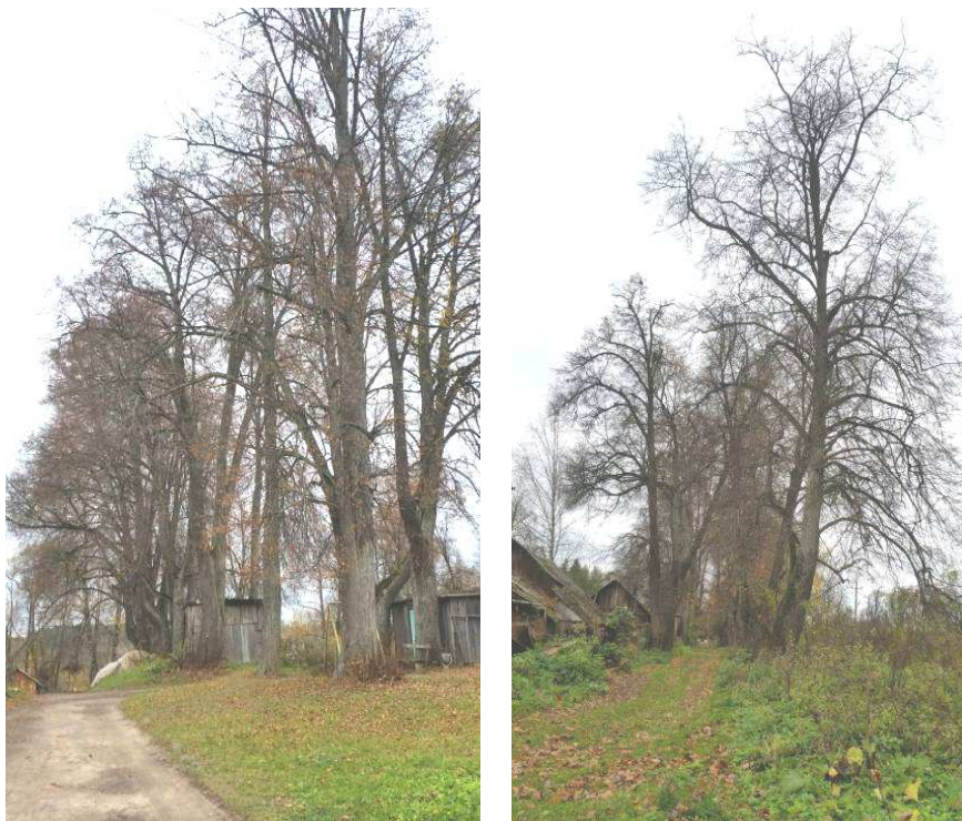
Рисунок 5. – Бывшая въездная липовая аллея

в результате которых от шляха к новому дворцу была сформирована новая въездная аллея, длина которой составляла около 150 м, а ширина 8–10 м.