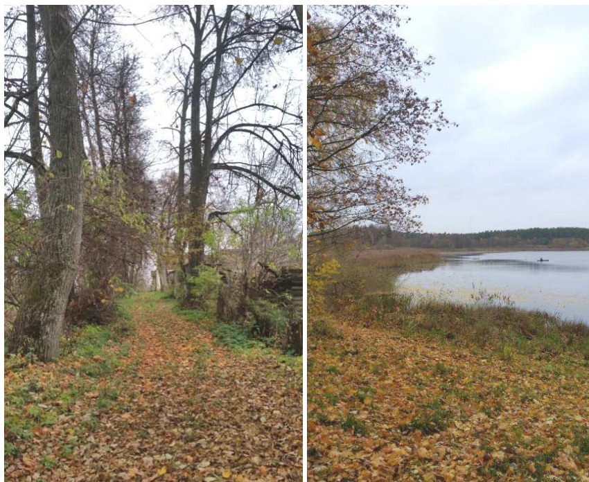
Рисунок 7. – Фрагменты прогулочной аллеи вокруг озера Ореховно

рами и цветниками. В соответствии с новыми тенденциями включал элементы старой планировки и деревья ценных пород более ранней посадки. Сохранились фрагменты прогулочной аллеи вокруг озера с тополями, ивами и сиренью (рисунок 7).