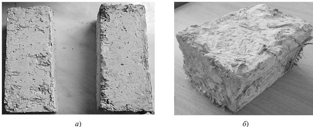
Рис. 2. Образцы из конструкционно-теплоизоляционного фибробетона с органическими фибровыми наполнителями растительного происхождения: а – изготовленные в формах; б – выпиленный из массива

Композитный конструкционно-теплоизоляционный фибробетон с органическими фибровыми наполнителями растительного происхождения. В принципе этот материал (рис. 2) может рассматриваться как современный аналог самана (саманного кирпича), лемпача, используемого с давних времён для строительства мазанок. Саманный кирпич изготавливался из глины с примесью соломы и добавок, улучшающих свойства композита.