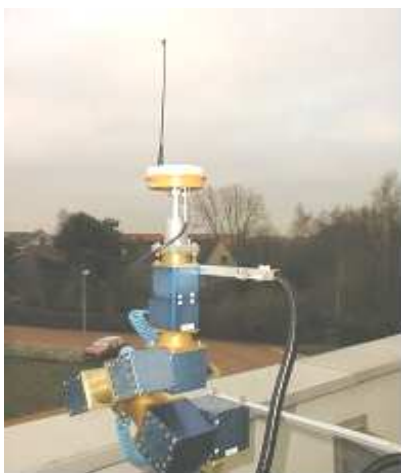
Рисунок 2 – Робот DSNDGU_002_UHF*, выполняющий абсолютные калибровки антенн

Идентичные многолучевые условия возникают при прохождении одного и того же спутникового созвездия над одной и той же точкой. Различия между РСВ-смещениями, выполненными при статических наблюдениях на точке в один день и наблюдениях с изменением ориентации (повороты и наклоны) в другой день, дают возможность определить истинные значения вариаций фазового центра антенны без эффекта многолучевости путем сферического гармонического анализа. Калибровка, свободная от эффекта многолучевости, также может быть получена в безэховой камере (рис. 3) аналогичным способом с использованием робота [4]. Отличием является то, что антенна принимает сгенерированный синусоидальный сигнал, а не реальный.