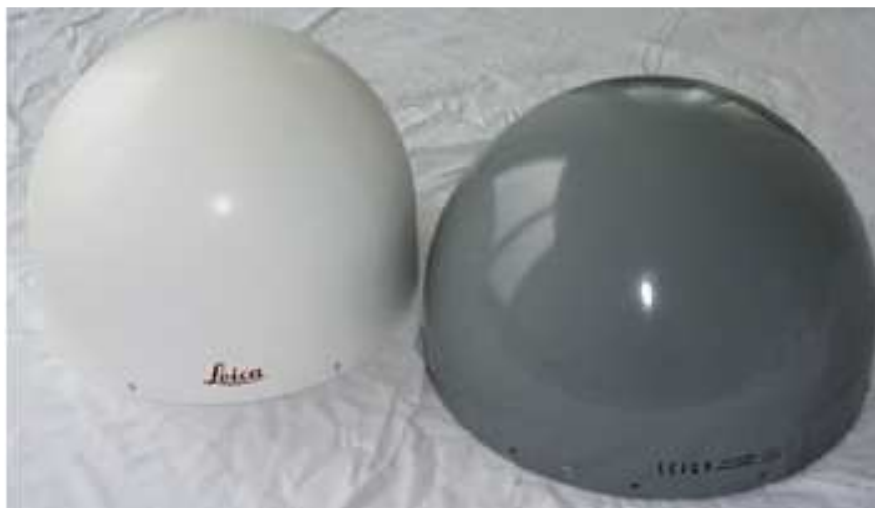
Рисунок 5 – Внешний вид куполов Leica LEIS и SCIS для антенны LEIAT504

Выполненная оценка влияния использования различных куполов при обработке используемых ранее векторов сети EUREF представлена в таблице 5.