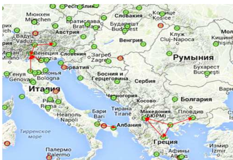
Рисунок 4 – Схема векторов, используемых для оценки влияния использования относительных и абсолютных калибровок

В рамках исследования авторами выполнена оценка влияния использования относительных и абсолютных калибровок путем обработки 10 векторов, имеющих различную длину, возвышение, тип используемого оборудования и геометрию спутникового созвездия (рис. 4).