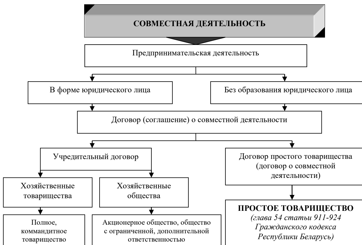
Рисунок 2. – Организационно-правовые формы совместной деятельности в условиях Республики Беларусь

На данном этапе исследования можно сделать вывод о том, что в Республике Беларусь законодательных требований к организационно-правовой форме кластера нет. Наиболее приемлемой формой сотрудничества является заключение между участниками инновационно-промышленного кластера договора простого товарищества (договора о совместной деятельности) без образования юридического лица. При этом термин «совместная деятельность» характеризует не организационно-правовую форму предпринимательской деятельности, а непосредственно предпринимательскую деятельность, основанную на кооперации организаций в различных отраслях экономики. На рисунке 2 представлены организационно-правовые формы совместной деятельности в условиях хозяйствования Республики Беларусь.