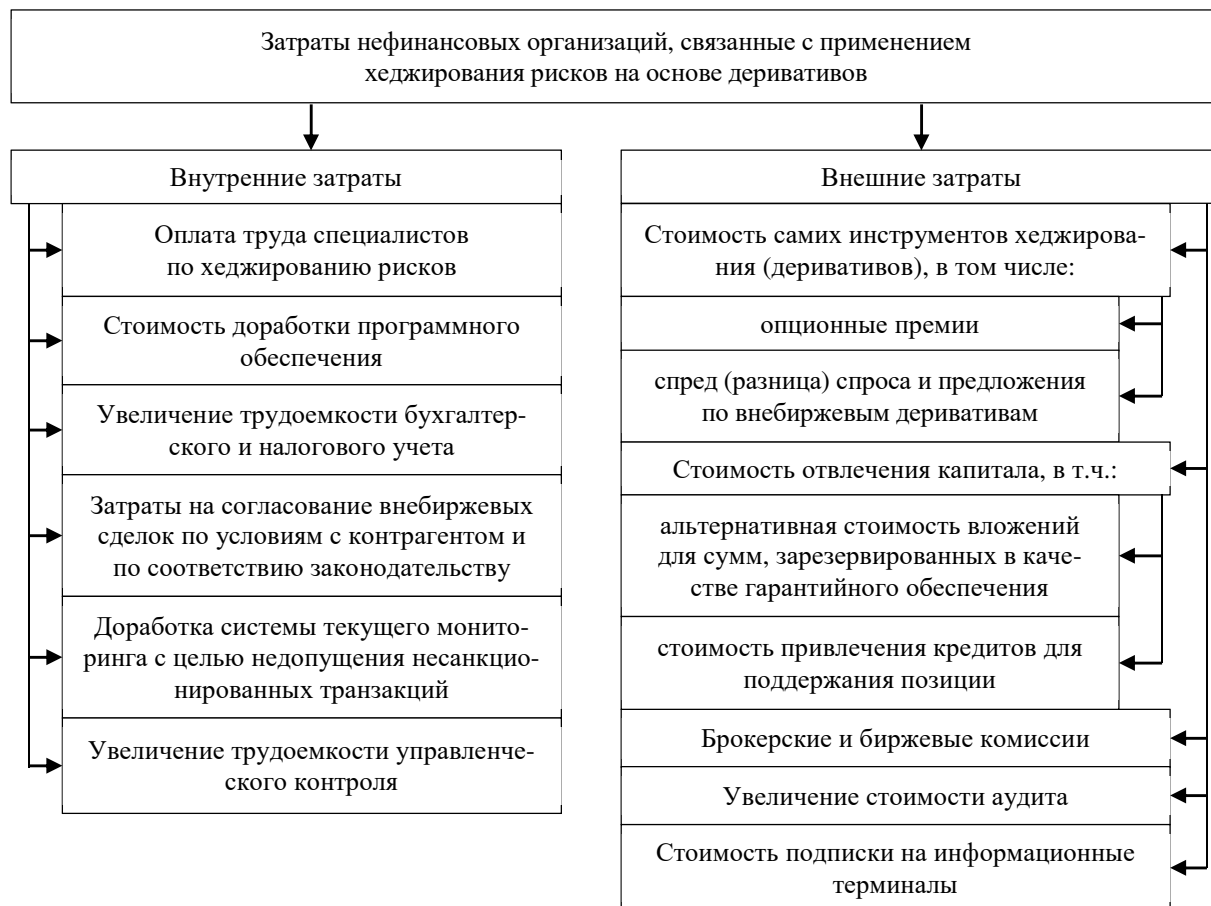
Рисунок 2. – Затраты, связанные с применением деривативов, используемые для оценки эффективности хеджирования рисков в рамках предлагаемого экономического подхода

Таким образом, в отношении подходов к оценке эффективности хеджирования с помощью деривативов согласимся с мнением Сафоновой Т.Ю., которая отмечает, что «эффективность хеджирования можно оценивать только с учетом основной деятельности компании, а также степени риска, который компания для себя допускает» 16 . Для этого нами предлагается экономический подход к оценке эффективности хеджирования рисков с помощью деривативов, который предполагает сопоставление достигнутых эффектов и связанных с этим затрат и рисков. Предлагаемый экономический подход в отличие от других подходов основан на анализе не только показателей, характеризующих параметры конкретной стратегии хеджирования, но и эффектов от использования деривативов, влияющих на совокупный результат деятельности организации.