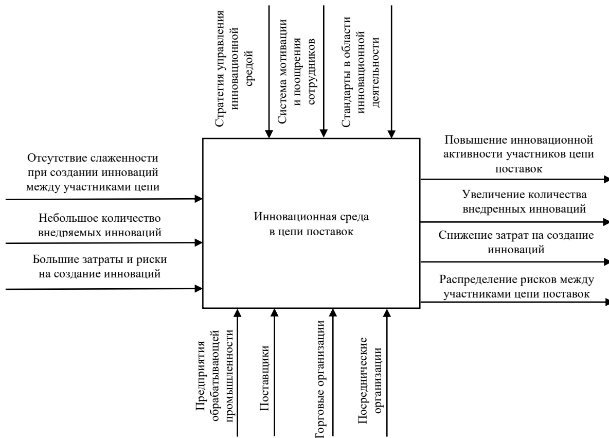
Рисунок 1. – Концептуальная схема функционирования инновационной среды в цепях поставок организаций

риалов, готовой продукции и т.д., так как часто возникают ситуации, когда закупленное программное обеспечение у одного участника цепи поставок несовместимо с остальными участниками, вследствие чего возникают дополнительные затраты времени на перевод документов в другой формат данных;