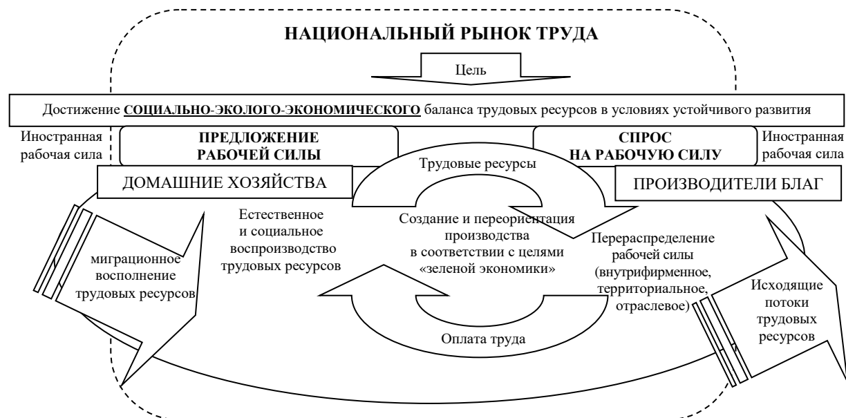
Рисунок 1. – Рециркуляция трудовых ресурсов, участвующая в метаболизме устойчивого развития национального рынка труда

Основная часть. На рисунке 1 представлена авторская схема функционирования рынка труда в контексте концепции устойчивого развития.