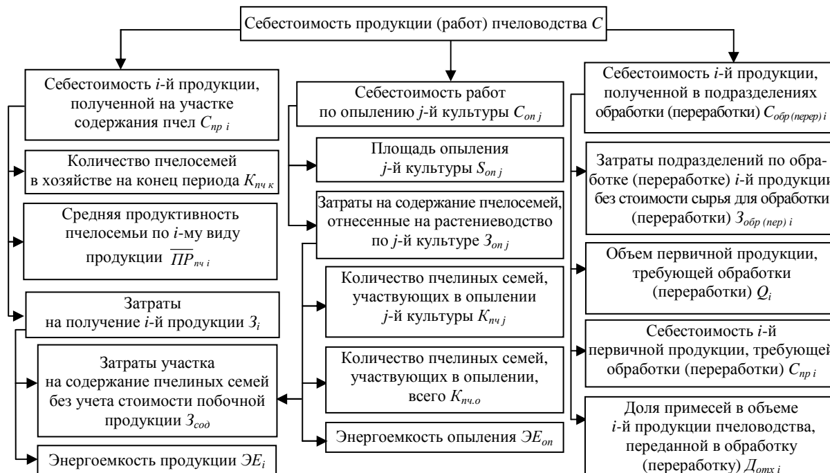
Рисунок 3 – Структурно-логическая схема факторного анализа себестоимости первичной и вторичной продукции пчеловодства

Структурно-логическая схема проведения факторного анализа себестоимости продукции пчеловодства с учетом специфики производства представлена на рисунке 3.