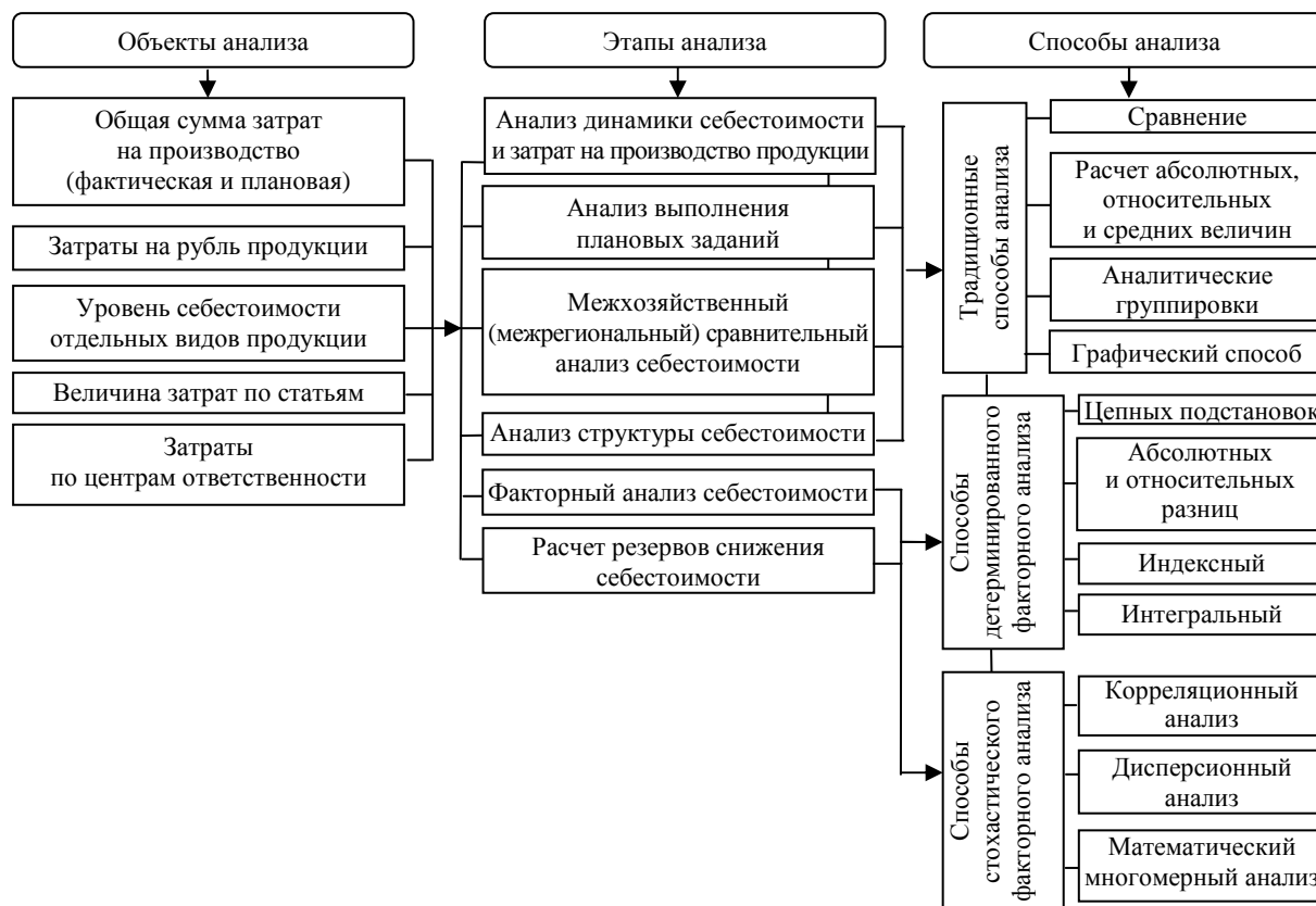
Рисунок 1 – Действующая методика анализа затрат на производство и себестоимости продукции

информационная база для анализа затрат по структурным подразделениям. В пчеловодстве старший пасечник должен составить отчет о затратах пасеки и их отклонениях от плановых показателей для предоставления главному зоотехнику, который в свою очередь должен группировать информацию по всем пасекам и предоставлять отчет заместителю директора по производству. В связи с ростом актуальности повышения эффективности производственной деятельности пчеловодческих хозяйств возрастает необходимость в разработке методики анализа затрат и себестоимости продукции по местам возникновения, которая позволит получить информацию о причинах изменения затрат на производство в целом по хозяйственной единице и в разрезе производственных подразделений для усиления контроля над расходом ресурсов.