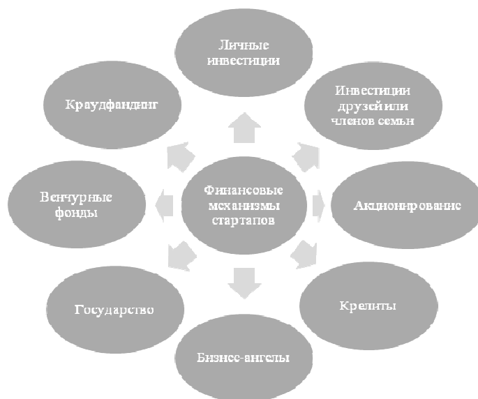
Рисунок 3. – Систематизация действующих финансовых инструментов развития стартапов

Недооценка фактора финансирования признана основным тормозом инновационного развития государства, поэтому работу по активизации инновационной деятельности эксперты Европейской экономической комиссии ООН рекомендуют начинать с увеличения объемов ее финансирования и, в частности, за счет развития деятельности стартапов. В этой связи представляется необходимым рассмотреть действующие финансовые инструменты стартапов, представленных на рисунке 3. В качестве наиболее распространенных в зарубежных странах источников финансирования выступают личные инвестиции, представляющие собой собственные сбережения владельцев стартапов, которые чаще всего используются на начальной стадии. В случае если данная стадия заканчивается успешно, это обстоятельство способно привлечь для дальнейшего запуска стартапа сторонних инвесторов.