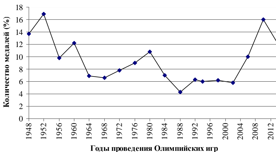
Рис. 3. Медальный зачет США в зимних Олимпийских играх [4]

Результаты сборной США на зимних Олимпийских играх показаны на рис. 3. По ним можно предположить, что американские зимние виды спорта не смогли разработать эффективную стратегию развития, способную обеспечивать постоянный уровень успеха. Сборная США редко возглавляла медальный зачет, а также выступала нестабильно.