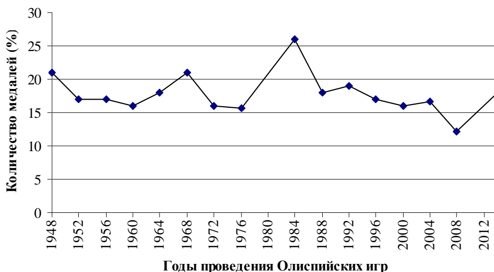
Рис. 2. Медальный зачет США в летних Олимпийских играх [4]

Отсутствие должной координации в системе управления спортом в США выглядит довольно архаично и это притом, что спортсмены этой страны постоянно лидируют в олимпийских соревнованиях. Процент олимпийских медалей, заработанных американскими спортсменами на летних Олимпийских играх, начиная с 1948 г., показан на рис. 2.