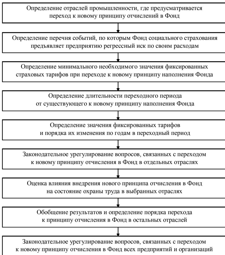
Рис. 2. Механизм изменения процесса формирования Фонда социального страхования от несчастных случаев и профессиональных заболеваний

Ввиду этого может быть предложен следующий механизм изменения процесса наполнения солидарного фонда (рис. 2), который может быть реализован при внесении соответствующих изменений в действующее законодательство по вопросам охраны труда [10, 11].