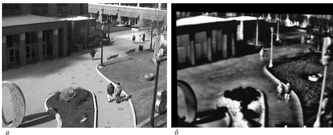
а – видимый диапазон; б –инфракрасный диапазон

Видео представляет собой съюстированные по времени и углу обзора последовательности изображений видимого и ИК-диапазонов. Фрагменты данных видеопоследовательностей представлены на рисунке 3.