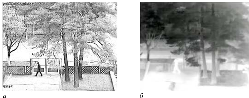
a – видимый диапазон; б – инфракрасный диапазон