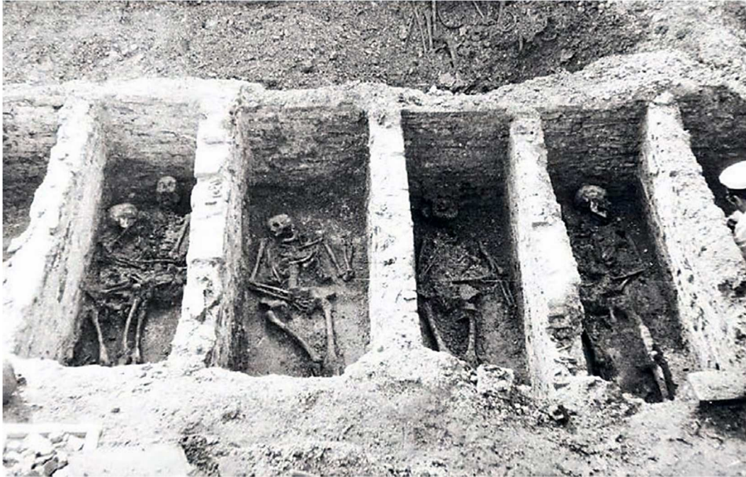
Малюнак 1. – Пахаванні ў саркафагах з храма-пахавальні Спаса-Еўфрасіннеўскага манастыра Паводле А.В. Вайцяховіча [6, с. 192].

Пахаванні здзяйсняліся і ў Спаскай царкве. Аб гэтым сведчаць аркасоліі ў паўночнай і паўднёвай сценах храма, а таксама саркафагі пад яго галярэямі [4, с. 24, 33, 36]. Акрамя гэтага, на поўдзень ад асноўнага аб’ёму царквы быў адкрыты невялікі падземны храм з аркасоліям. Аркасоліі і саркафагі маглі прызначацца для пахавання кцітараў [3, с. 47–48]. Не выключана, што ўнутры храма хавалі таксама настояцельніц манастыра.