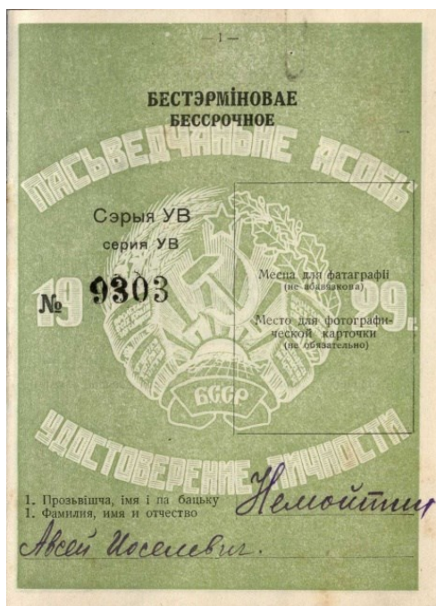
Малюнак 2. – Пасведчанне асобы Аўсея Ёселевіча Нямойціна – рабіна г. Віцебска, 1929 г. [21, арк. 14 адв.]

Вывучаемы перыяд з’яўляўся дастаткова нестабільным у палітычных адносінах, што ў сваю чаргу пацягнула за сабой і сацыяльныя трансфармацыі. Рэлігійныя дзеячы вымушаны былі адчуць на сабе змену сацыяльнага статусу. Выпадкі адмовы рабінаў і рэзнікаў ад культывавай дзейнасці асабліва пачасціліся з канца 1920-х гг. Некаторыя з іх уладкоўваліся на некваліфікаваную працу, але пры гэтым змена сацыяльнага стану не заўсёды азначала адмову ад прыхільнасці да іўдаізму: былыя рэлігійныя служыцелі працягвалі займаць актыўную грамадскую пазіцыю [41, арк. 29].