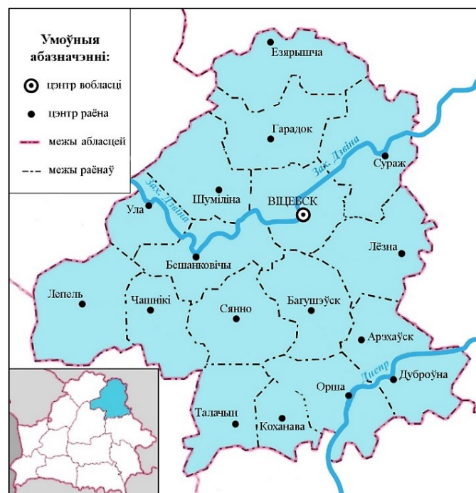
Малюнак 1. – Віцебская вобласць у 1946–1954 гг.

Мэта дадзенага артыкула – разгледзець стан стараверскіх абшчын Усходняй Віцебшчыны ў першае пасляваеннае дзесяцігоддзе (1945 – сярэдзіна 1950-х гг.). Рэгіён даследавання будзе складаць тэрыторыя Віцебскай вобласці 1 ў межах таго часу (малюнак 1). Асновай для даследавання стаў комплекс матэрыялаў Дзяржаўнага архіву Віцебскай вобласці (фонды 1439 і 4029).