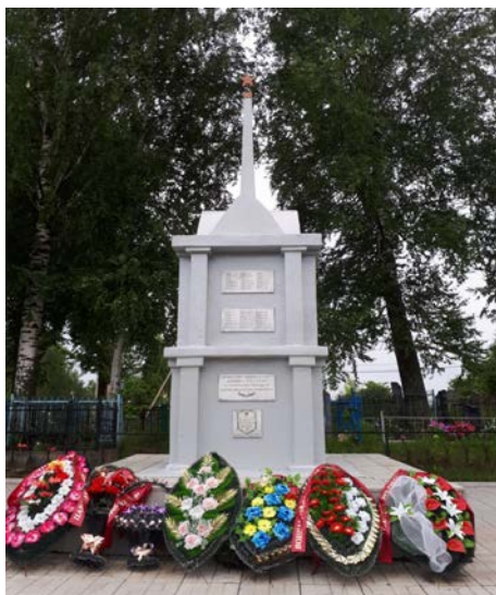
Рисунок 3. – Братская могила на Фатыновском кладбище. Фото автора, 2017 г.

На данный момент на Фатыновском кладбище увековечено согласно паспорту воинского захоронения № 4252 123 человека, из них известно 122, неизвестно – 1 [30]. На табличке по факту нанесено 116 фамилий; по спискам книги «Память» – 126 человек [27, с. 624–627]. Такой разброс в цифрах связан с появлением «двойников», с повтором искаженных и правильно написанных фамилий в надписях.