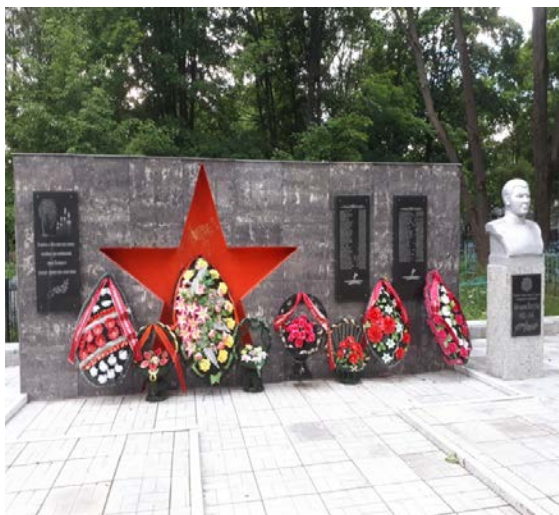
Рисунок 4. – Братская могила на Красном кладбище. Фото автора, 2017 г.

Самым немногочисленным воинским захоронением является братская могила № 4254 на Ксаверьевском кладбище (рис. 5) , по данным паспорта воинского захоронения – всего 15 человек, из них 11 – известных и 4 – неизвестных [32]. В данном случае на его территории осуществлялось непосредственно первичное захоронение воинов, умерших от полученных ранений в ЭГ № 1105, располагавшемся в г. Полоцке на протяжении с 11 июля по 1 ноября 1944 г. [34]. Захоронение представляет собой общую могилу на 8 человек. Кроме того, сюда же были перезахоронены еще 3 человека, в первичном месте захоронения которых указан г. Полоцк. В итоге имеем общее количество захороненных 11 человек.