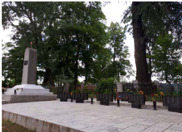
Рисунок 2. – Братская могила на Громовском кладбище. Фото автора, 2017 г.

Таким образом, в 1950 г. на Громовское кладбище были перенесены останки умерших от ран и полученных на фронте болезней солдат Красной Армии с территории «Софийской горки», где в разное время с 1944 по 1946 г. осуществляли захоронения ЭГ №№ 1969, 3443 и ВГ № 431, общим количеством предположительно 202 человека. Актов перезахоронения не сохранилось, подсчеты произведены по документам ОБД «Мемориал», а именно по книгам погребения и именованным спискам. Следует сразу же оговориться, что эта цифра не окончательная и требует дальнейшего исследования.