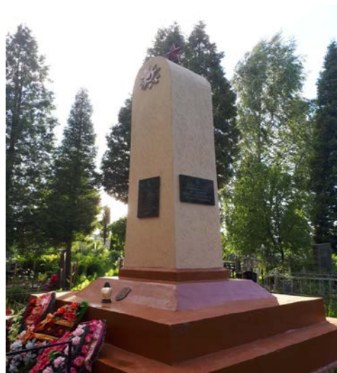
Рисунок 5. – Братская могила на Ксаверьевском кладбище. Фото автора, 2017 г.

Таким образом, на примере братских могил, расположенных на пл. Свободы, Красном, Фатыновском, Громовском и Ксаверьевском кладбищах, был рассмотрен процесс увековечения памяти о погибших воинах Красной Армии при освобождении г. Полоцка в июле 1944 г.