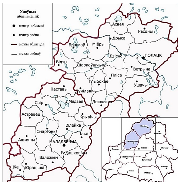
Малюнак 1. – Адміністрацыйна-тэрытарыяльны падзел у Паўночна-заходняй Беларусі (1945 г.)

Мэта дадзенай працы – даць характарыстыку стараверскім абшчынам рэгіёна ў пасляваенны перыяд (1945–1950-я гг.). Асновай для даследавання стаў комплекс архіўных матэрыялаў аб дзейнасці стараверскіх абшчын, якія адносяцца да справаводства Савета па справах рэлігійных культаў (ССРК). Гэты орган быў створаны ў СССР яшчэ ў 1944 г. для кантроля дзейнасці рэлігійных арганізацый, акрамя Рускай Праваслаўнай царквы (для яе кантролю быў створаны асобны орган). Разам з цэнтральным ССРК, які дзейнічаў пры СНК СССР (з 1946 г. – пры Савеце Міністраў), пры рэспубліканскіх СНК (з 1946 г. – пры Саветах Міністраў) і абласных выканкамах быў сфарміраваны інстытут упаўнаважаных Савета. У працы выкарыстаны матэрыялы, якія захоўваюцца ў Нацыянальным архіве Рэспублікі Беларусь і Дзяржаўным архіве Віцебскай вобласці. Геаграфічныя межы даследавання ахопліваюць тэрыторыю Паўночна-заходняй Беларусі. У адзначаны перыяд гэтая тэрыторыя адносілася да розных адміністрацыйных адзінак. З 1944 г. землі ўваходзілі ў склад Полацкай і Маладзечанскай абласцей. Яшчэ ў 1939 г. паўночна-заходнія раёны Беларусі былі аб'яднаны ў Вілейскую вобласць, якая ў 1944 г. была перайменавана ў Маладзечанскую. У тым жа годзе частка яе раёнаў была перададзена ў склад Полацкай вобласці (Малюнак 1). Але ў 1954 г. Полацкая вобласць была ліквідавана і яе дзевяць раёнаў ізноў былі перададзены ў склад Маладзечанскай, якая ў 1960 г. была скасавана і тэрыторыі адыйшлі ў склад Віцебскай, Мінскай і Гродзенскай абласцей.