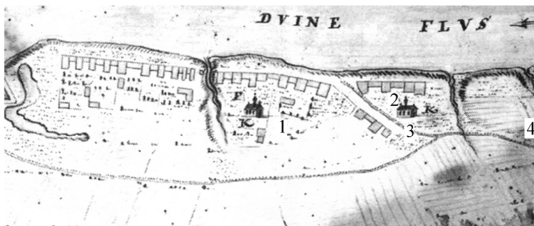
Рис. 2. План Полоцка 1720-х гг. [5, с. 26] (вверху) и копия части плана с обозначением топографических объектов, упомянутых в ревизии (внизу):

1 – церковь св. Николая; 2 – бернардинский кляштор; 3 – улица Великая; 4 – Бельчицкий Борисоглебский монастырь и местность «Кобак Боханьских»