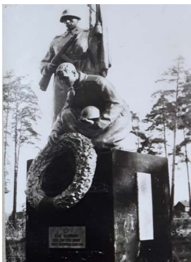
Рисунок 5. – Братская могила № 2344 на месте захоронения военнопленных, партизан и жертв нацизма и в г.п. Боровуха. Фото 1980-х гг.

11 человек 1115 сп 332 сд, погибшие 2 июля 1944 г., первично захоронены на «окраине зелёной рощи восточнее разъезда Шалашки» [23], а также 8 человек 64 гв. сп 21 гв. сд, также погибшие 2 июля 1944 г., захоронены «300 м. северо-восточнее разъезда Шалашки» [24], на данный момент увековечены в братской могиле № 2344 на территории Боровухского с/с (рис. 5). По причине того, что разъезд Шалашки (теперь станция Поздняково ж/д Полоцк – Невель), который в 1940-е гг. относился к Полотовскому с/с, ошибочно принят за д. Шалашина Боровухского с/с, солдаты 332 сд и 21 гв. сд. оказались увековеченными в Боровухском с/с.