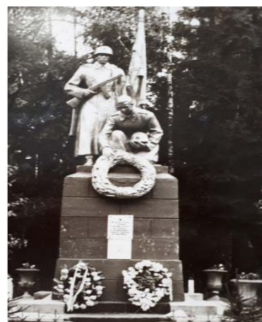
Рисунок 1. – Братская могила № 4261 в г.п. Боровуха Фото 1980-ых гг.

Согласно Акту о перезахоронении от 1949 г. в одной могиле были увековечены солдаты Красной Армии общим количеством в 120 человек, из них: «в районе деревень ст. Боровуха-1 было обнаружено 11 братских могил и 31 индивидуальная» общим количеством в 84 человека; «в районе деревень Гвоздово,