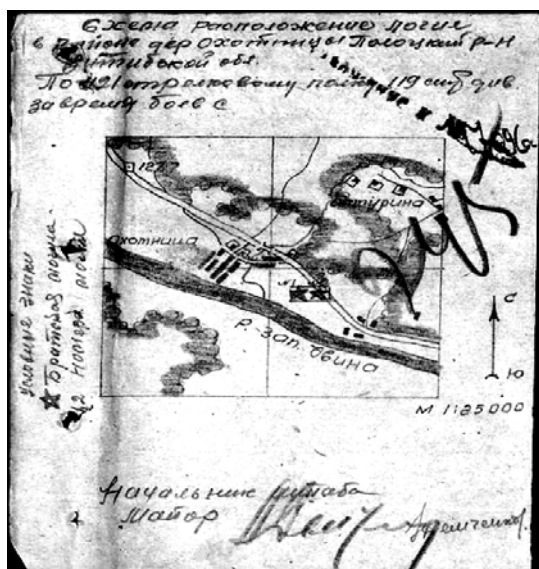
Рисунок 3. – Схема расположения могил в районе д. Охотница Полоцкого р-на [12]

Воины 634 сп 119 сд, погибшие 5 июля 1944 г., изначально захоронены в д. Залесье Боровухского с/с, согласно именному списку общим количеством 6 человек [20], к которому прилагается также карта-схема (рис. 4), что даёт нам основание точно определить принадлежность того или иного населённого пункта к конкретному сельскому совету, т.к. только на территории Полоцкого р-на насчитывается восемь деревень Залесье. В именном списке указано 6 человек, в легенде к карте-схеме – 7 человек. Вероятно, при заполнении произошла техническая ошибка, что в принципе в тех условиях не вызывает удивления. И снова все без исключения в 1949 г. были перезахоронены в братскую могилу № 4261, но увековечены имена только двух человек и то в братской могиле № 2344. В тоже время на памятнике нанесена фамилия лейтенанта 16 Литовской сд Юкниса Владаса, первичное место захоронения которого по именным спискам указано «150 м. от дороги д. Залесье – Нарковщина около кустарника» [13]. В решении данного вопроса помогает приложенная к именному списку погибших карта-схема, при анализе которой выясняется, что д. Залесье Боровухского с/с перепутано с д. Залесье Юровичского с/с Полоцкого р-на. Соответственно, лейтенант в принципе не может быть перезахороненным в братской могиле № 2344.