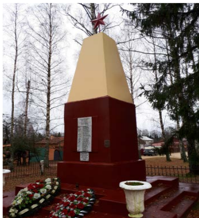
Рисунок 2. – Братская могила № 4261 в г.п. Боровуха 2017 г.

Охотница, Коптево, Горовые и Ропно» – 3 братские могилы и 19 индивидуальных (всего 27 человек); «в районе деревень Махирово, Дяготки и Залесье» – 2 братские могилы и 5 индивидуальных (всего 9 человек) [7, л. 19]. К документу прилагается и список из 13 известных, а непосредственно в Акте указано 110 неизвестных из 120 человек. Вероятно, подсчёт сделан неверно. Далее при суммировании имеем всего 16 братских могил и 55 индивидуальных (всего 71 могила) [7, л. 19], а в выписке из Плана мероприятий по переноске могил от 14 марта 1949 г. по Махировскому с/с – 136 могил, приказано оставить только лишь одну могилу около школы (индивидуальная могила Д. Потапенко – А. К.) [8, л. 40].