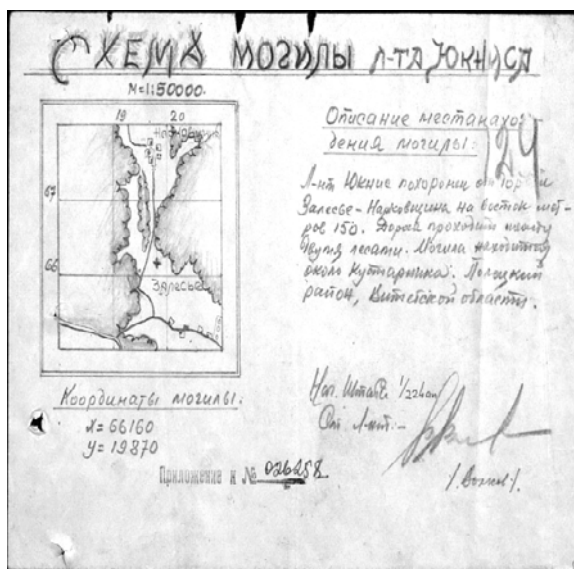
Рисунок 4. – Схема могилы лейтенанта Юкниса В. В районе д. Залесье Юровичского с/с Полоцкого р-на [13]

Мл. сержант 364 отдельного пулемётного артбатальона 155 Укрепрайона (далее УР) Макарьин Фёдор Фёдорович 1909 г.р. погиб 3 июля 1944 г. и захоронен «на кладбище у дороги 1 км. южнее д. Заручевье Полоцкого р-на» [25]. В данном случае карты-схемы не имеем, но при анализе данных журнала боевых действий 4 Ударной Армии выясняется, что 155 УР на период с 1 по 5 июля 1944 г. дислоцировался и участвовал в военных действиях в северо-восточной части Полоцкого р-на [5]. Снова сталкиваемся с тем, что д. Заручевье Боровухского с/с ошибочно принято за д. Заручевье Малоситнянского с/с Полоцкого р-на. Соответственно, останки мл. сержанта Макарьина Ф.Ф. не могли быть перенесены на территорию Боровухского с/с.