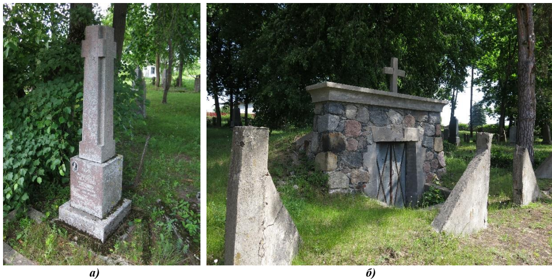
Малюнак 6. – Надмагілле Вінцэнта Унятыцкага (а) і склеп (б) на новай частцы могілак. 2022 г.

Найбольш цікавым помнікам гэтай часткі могілак можна назваць надмагілле павятовага віцэстарасты Вінцэнта Унятыцкага, памерлага ў 1936 г. (малюнак 6, а) Помнік уяўляе сабой мадэрністычную стэлу чырвонага граніту, вырашаную профілямі чатырох крыжоў на кожнай грані, змешчаную на невысокім пастаменце. На пастаменце выразана эпітафія і размешчаны партрэт памерлага. Тэкст эпітафіі вельмі лаканічны: Ś.P. | Wincenty | UNIATYCKI | wicestrosta | powiatowy | *17-XI-1879 +15-VII-1936 | Cześć jego pamięci. Тэрыторыя пахавання была акружана агароджай, ад якой застаўся толькі змураваны з каменя контур і невялікія рэшткі металічных канструкцый. Злева ад помніка знаходзіцца вялікі склеп, вырашаны ў форме мураванага з каменя і бетону партала, які замыкае земляны насып над склепам (малюнак 6, б). Склеп быў разрабаваны: металічныя дзверы яго сёння зачынены. Інфармацыя пра тое, якой сям'і ён належаў, адсутнічае. Прастора вакол склепа была акружана агароджай, ад якой засталіся толькі мадэрністычныя высокія трохкутныя элементы.