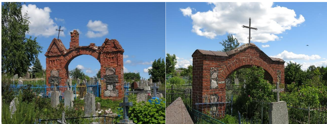
Малюнак 2. – Брамы браслаўскіх могілак. 2022 г.

Невялікая колькасць гістарычных надмагілляў дазваляе разгледзець многія з іх дастаткова дэтална, нават, у межах аднаго артыкула. Для гэтага мы пачнём з большай і старэйшай усходняй часткі могілак.