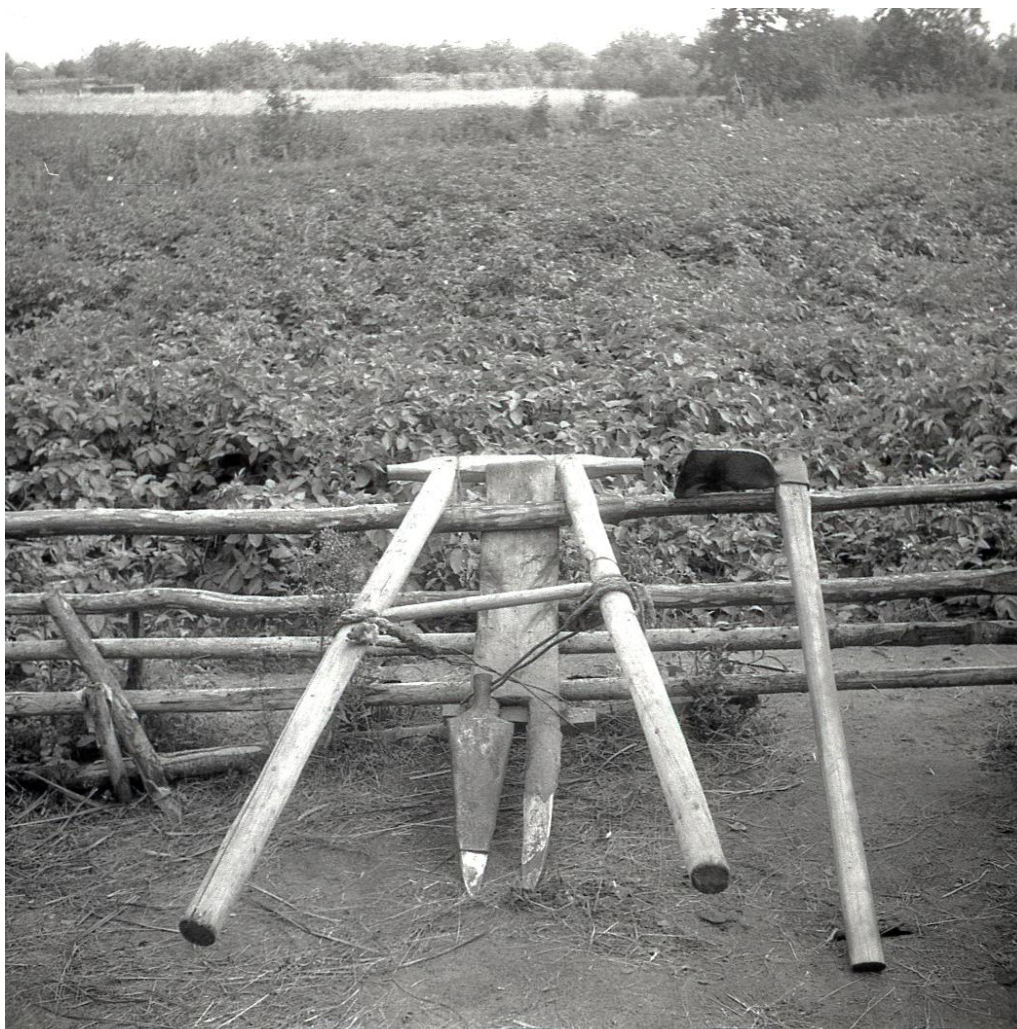
Малюнак 4. – Саха для абворвання бульбы ў в. Казімірова Полацкага раёна. Фота М.Я. Грынблата Крыніца: АІМЭФ. Нег. № 2992.

Асаблівая ўвага ў часе экспедыцыі надавалася апісанню традыцыйнай ворнай прылады мінулага – сахі 14 , якую М.Я. Грынблат разглядаў у якасці «вядомай падставы для вызначэння паўночна-ўсходняй мяжы рассялення дрыгавічоў і паўднёва-заходняй мяжы рассялення крывічоў-палачан» [40, с. 125] (малюнак 4). Калі «палеская» (або «літоўская») двузубая саха для парнай валавой вупражы характарызувалася ім як своеасаблівы маркер дрыгавіцкай тэрыторыі, то адзнакай тэрыторыі крывічоў выступала больш лёгкая «фруская» саха з перакідной паліцай для конскай вупражы [38, с. 214–217]. У выніку палявых даследаванняў 1954 г. былі ўсталяваны паўночны і паўночна-ўсходнія рубяжы пашырэння сахі «палескага» тыпу, якія дасягалі на поўначы сучасных межаў Літвы, а на паўночным усходзе – сярэдзіны Астравецкага раёна. Далей на паўночны ўсход была выяўлена паласа пераходнага тыпу сахі (у межах Свірскага і Пастаўскага раёнаў), а затым, пачынаючы з Відзаўскага раёна, пачыналася паласа другога тыпу сахі, характэрнай для тэрыторыі колішняга рассялення крывічоў 15 [40, с. 125].