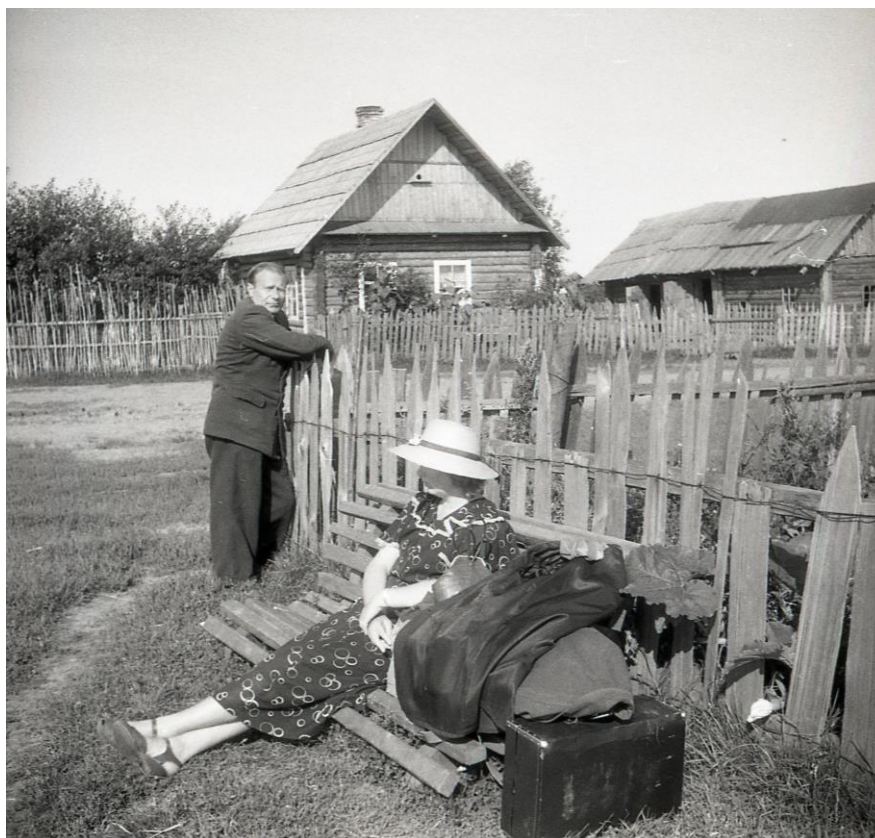
Малюнак 3. – Удзельнікі экспедыцыі Л.А. Малчанавы і С.Ц. Гунько ў в. Янкваічы Расонскага раёна. Фота М.Я. Грынבלата Крыніца: АІМЭФ. Нег. № 2991.