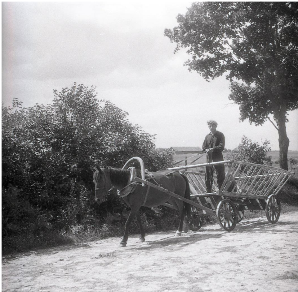
Малюнак 5. – “Рэды” або воз для сена ў в. Сіпавічы Відзаўскага раёна. Фота М.Я. Грынблата Крыніца: АІМЭФ. Нег. № 2972.

Як М.Я. Грынблат паведамляў у публікацыі, што з’явілася па выніках экспедыцыі: «Каштоўнымі дадатковымі дадзенымі для вывучэння этнічнай гісторыі беларусаў, для ўдакладнення міжплемянных меж з’явіцца таксама сабраныя экспедыцыяй матэрыялы аб абласных асаблівасцях ў тыпах паселішч, жылля, гаспадарчых пабудоў, адзення, у ежы, а таксама ў звычаях і абрадах (у прыватнасці, купальскім і валачобным), у народнай тэрміналогіі» [40, с. 125] (малюнак 5).