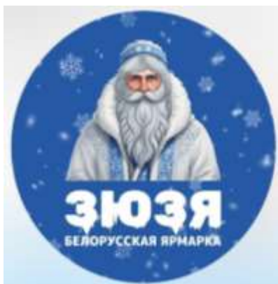
лагатып кірмаша “Зюзя” 8

Перавынаходніцтва вобраза Зюзі ў першай чвэрці ХХІ ст. На пачатку ХХІ стагоддзя з ростам запыту на міфалогію і развіццём медыя для Зюзі наступіў паваротны момант: ён стаў вядомы шырокаму колу прадстаўнікоў розных сфер дзейнасці, кожны з якіх атрымаў магчымасць узяць з вобраза тое, што патрэбна менавіта яму, і скарыстаць гэта ў сваіх мэтах. Так Зюзя перастаў быць выключна літаратурным персанажам, займеў шмат новых кропак для далейшага развіцця і разнастайныя візуальныя адлюстраванні (малюнак 1). Яны не заўсёды суадносяцца з апісаннямі Зюзі ў літаратурных крыніцах ці нават утрымліваюць антрапаморфную фігуру, але нязменна, хоць і не абавязкова відавочна, звязаныя з зімовым сезонам: нішто на лагатыпе брэнда світараў (гл. малюнак 1) не нагадвае пра зіму, але самі світары – цёплае адзенне, якое носяць зімой.