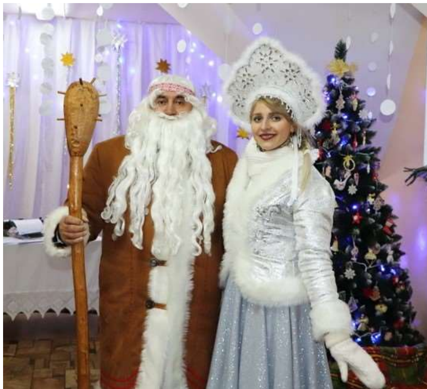
Малюнак 5. – Бераст-Зюзя і Спадарыня Завея, фотаздымак С. Ганчаровай 29

Прывязка Зюзі да пэўнага рэгіёна Беларусі – цалкам сучасная з’ява: ніхто з вышэйзгаданых аўтараў-апісальнікаў Зюзі не прымяркоўваў гэтага персанажа да асобнай мясцовасці, нават А. Шыmanoўскі, які прысвяціў сваю працу Мінскай губерні, не сцвярджаў, што Зюзю ведалі толькі тут. Выпадак Зюзі ў гэтым сэнсе не ўнікальны: ён у поўнай меры адпавядае сусветнай тэндэнцыі зьяўлення да фалькларызму і народнай спадчыны пры распрацоўцы стратэгіі развіцця тэрыторый. Але цікавай падаецца адсутнасць выразнай канкурэнцыі паміж рознымі рэгіёнамі краіны за выключнае права прысвоіць Зюзю сабе. Можна дапусціць, што на такую сітуацыю