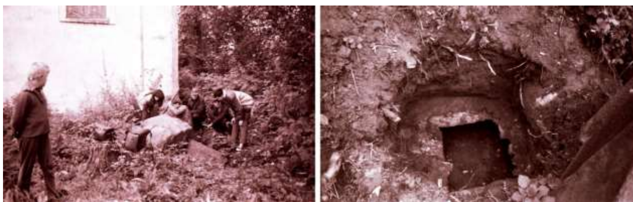
Рисунок 4. – Раскопки на месте склепа у северо-восточного угла храма и пролом в своде склепа (исследования и фотографии С.Н. Глушкова, предоставлены А.С. Зиновьевым)

Отдельные захоронения, видимо, были и против восточной стены апсиды. Ещё в период размещения в храме общежития, возле апсиды образовался провал в кирпичном своде подземного сооружения, и местные жители интерпретировали его, как подземный ход, по которому доходили до озера Ропно (возможно, из-за большой длины камеры). Рядом с ним лежали опрокинутые надгробия, одно из которых принадлежало титулярной советнице Пелагее Егоровне Городецкой. Скорее всего, это был склеп. По воспоминаниям полоцкого краеведа С.Н. Глушкова, который раскапывал и изучал данный провал, захоронения там не было, но глубина камеры (около 1,0 м) позволяла свободно установить гроб (рисунок 4).