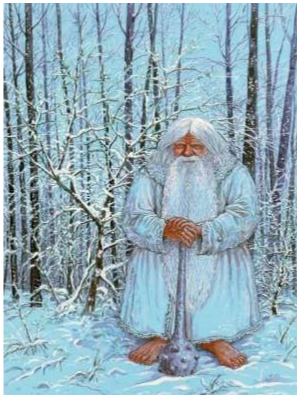
кніжная ілюстрацыя, В. Славук [23, с. 17]