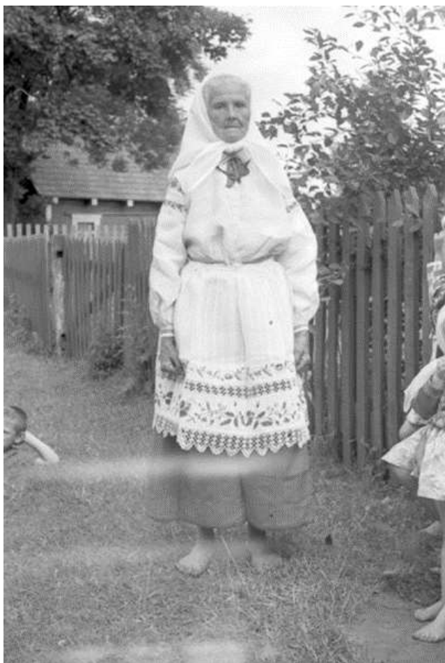
Рисунок 2. – Негатив 1984 г. Экспедиция 1980 – 90-х гг. д. Бездеж, Дрогичинского р-на Брестской обл. Передан в Белорусский государственный музей народной архитектуры и быта Романюком М.Ф.

и иные проявления народной культуры, имеющие историческое значение. Таковы, например, снимки из фондов Белорусского государственного музея народной архитектуры и быта, сделанные в 1980-х гг. в Пинском, Дрогичинском, Столинском, Кобринском районах Брестской области этнографом, искусствоведом М.Ф. Романюком, а также сотрудниками музея, где целью экспедиций было комплектование фондов музея 9 . Так, фотография 1984 г., сделанная М.Ф. Романюком в деревне Бездеж Дрогичинского района Брестской области, демонстрирует женщину в традиционном праздничном костюме 1920 – 30-х гг. Фотография фиксирует элементы традиционного быта и костюма, которые к 1980-м гг. уже находились на грани исчезновения. Одежда женщины – не только предмет утилитарного назначения, но и носитель культурной памяти: орнаменты, крой, способ ношения платка отражают многовековые традиции региона. Фоном является деревянный забор, типичный для деревенских усадеб Брестской области. За забором видны хозяйственные постройки (рисунок 2).