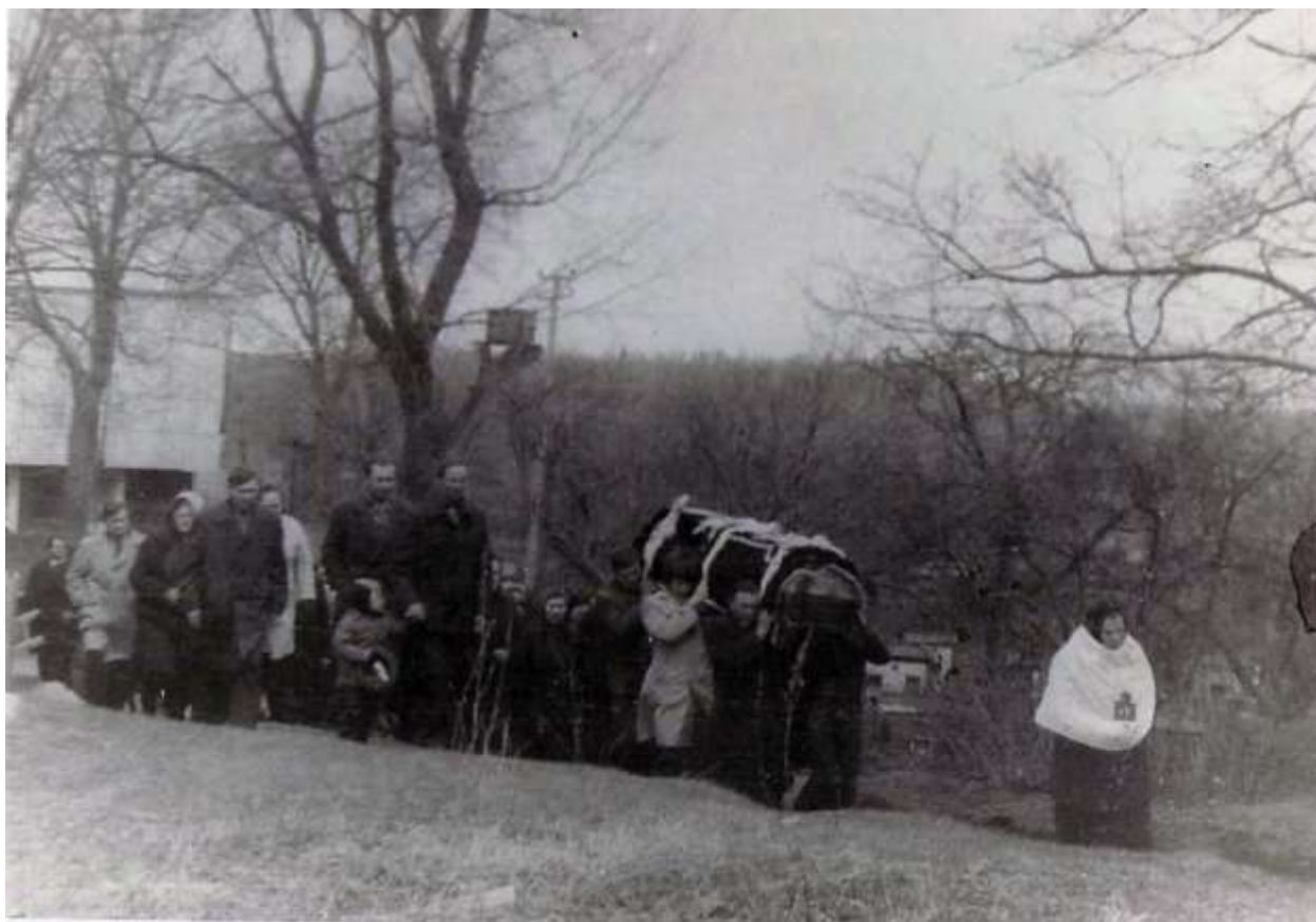
Малюнак 5. – Пахавальная працэсія, другая палова XX ст. З сямейнага архіва У.П. Васільевай, в. Мілейкі Мёрскага р-на

Важным этапам пахавальнага абраду з’яўляецца адпраўка памерлага на могілкі. Паводзіны людзей падчас руху працэсіі строга рэгламентаваліся. У першую чаргу гэта датычылася пахавальнага шэсця. Захоўваецца своеасаблівы характар пабудовы пахавальнай працэсіі (малюнак 5). Абавязкова наперадзе пахавальнага шэсця ідзе нехта з крыжам (часцей мужчына). Лічылася, што гэты крыж нельга браць голымі рукамі, а таму яго трымалі праз адмысловы ручнік (гл. малюнкi 1, 5). За ім неслі труну з нябожчыкам, а затым ішоў духоўны настаўнік з пеўчымі. За імі ішлі ўсе астатнія: “Несёт человек хрест, у полотенцу; и несёт упереду хрест. Раньше венков не было; не было венков никаких. Ни цвятов, ни венков. Хрест нясут и покойника. А за покойником идут певчие и батюшка, поют” (г.п. Шаркаўшчына) [1, с. 192].