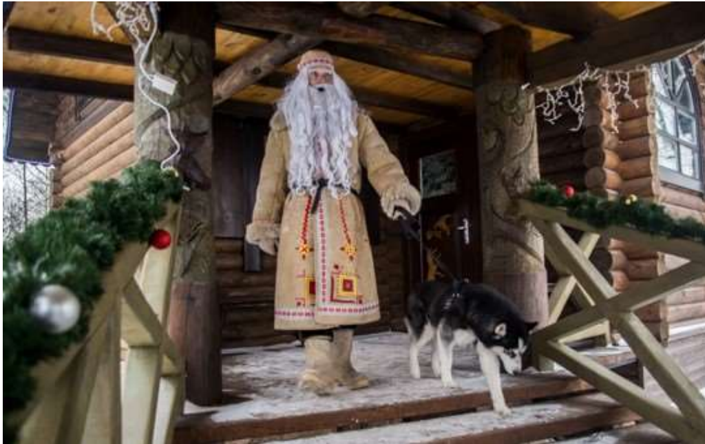
Малюнак 4. – Зюзя з Каробчыцаў, фотаздымак С. Людкевіча 28