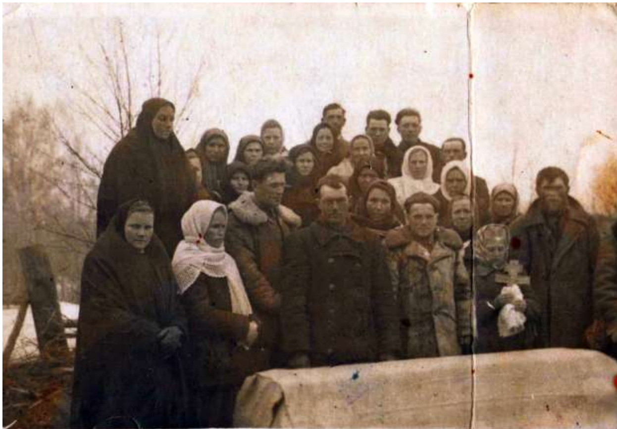
Малюнак 1. – Пахаванне ў старавераў Шаркашчынскага р-на.

смерць чалавека настае ў выніку таго, што той пражыў свай “век”. Такая абумоўленасць тлумачыцца сувязцю ў традыцыйнай свядомасці паняцця “век” (працягласць жыцця чалавека) з яго “доляй”, якая яму даецца пры нараджэнні. Варыянт “памерці сваёй смерцю”, паводле традыцыйных уяўленняў, з’яўляецца ідэальным. Да такіх нябожчыкаў адносіліся з глыбокай пашанай і іх рэгулярна паміналі. Іншыя варыянты смерці (“не сваёй”, заўчаснай) ва ўмовах традыцыйнага грамадства разглядаліся як непажаданыя [9, с. 143–144; 13, с. 131; 12, с. 40; 3, с. 102].