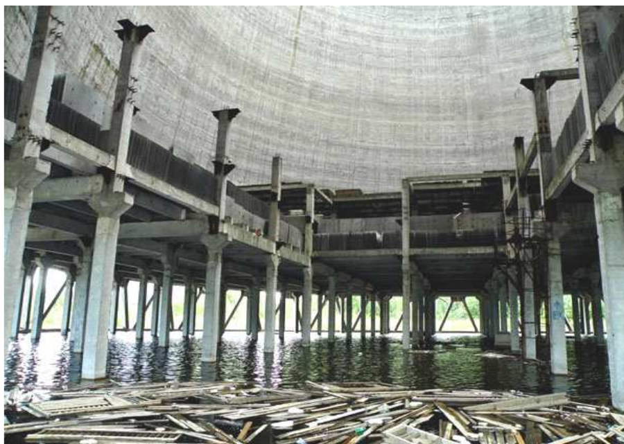
Рисунок 1. – Разрушение водораспределительной системы из-за дополнительных нагрузок от образовавшегося на ней льда

В зимнее время эксплуатация градирен осложняется из-за обмерзания их конструкций. Обледенение градирен может привести к аварийному их состоянию, вызывая деформации и обрушение оросителя вследствие дополнительных нагрузок от образовавшегося на нем льда (рис. 1).