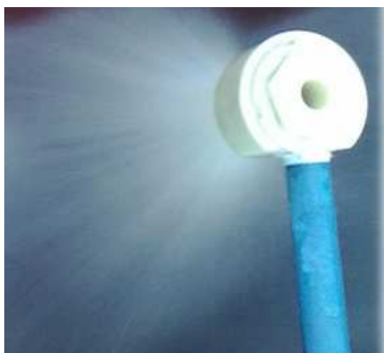
Рисунок 2. – Эжекционная форсунка

Охлаждение воды в установке происходит за счет тепломассообмена на высокоразвитой поверхности контакта водяных капель и воздуха, который подается в установку за счет эффекта эжекции (рис. 3).