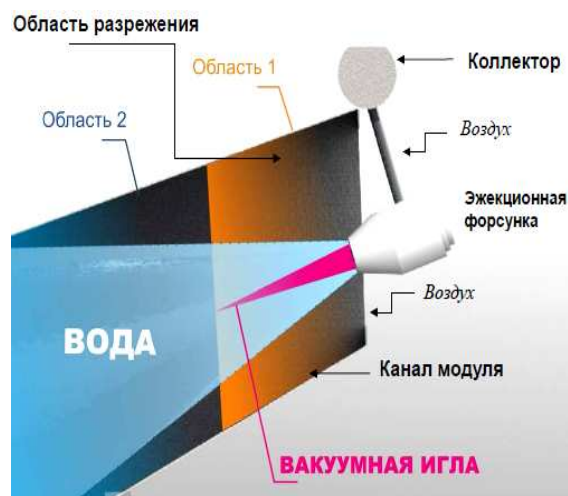
Рисунок 3. – Принцип работы эжекционной форсунки