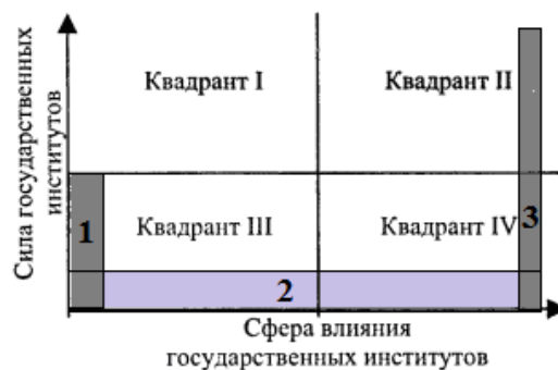
Рисунок 2. – Матрица силы (эффективности) и сферы влияния государственных институтов

агентства «Freedom House». На наш взгляд, наиболее полные характеристики представляются в исследованиях Всемирного банка. Это прежде всего показатели управления (governance indicators), которые были разработаны в начале 2000-х гг. Кауфманом, Креем и Мастрucci [10]. Также важной характеристикой для определения эффективности управления является показатель ВВП по ППС на душу населения, который также рассчитывается для каждого государства. На основе вышеобозначенных подходов Ф. Фукуямы разработана специальная матрица, в которой представлены две характеристики власти: сфера влияния государственных институтов и их сила («эффективность»). Матрица четко делится на четыре квадранта, которые создают различные перспективы для экономической и политической модернизации, а следовательно, для достижения и сохранения «конца истории» [8, с. 64]. На графике (рисунок 2) обозначим цифрами 1–3 зоны, «критические» для «конца истории».