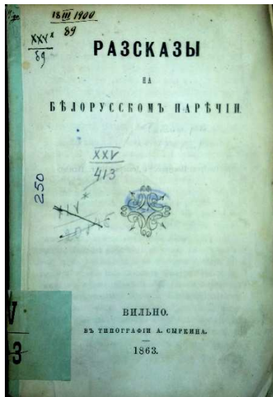
Малюнак 4. – Рассказы на белорусском наречии. Вильна, 1863

имѣть тутъ важное педагогическое значеніе, и по крайней мѣрѣ треть статей должна быть на немъ написана; въ такихъ мѣстностяхъ, гдѣ иноплеменники составляютъ большинство населенія, русскому языку научаются съ трудомъ и только въ высшихъ заведеніяхъ; тутъ, разумѣется, книга для народнаго чтенія невозможна на другомъ языкѣ, кромѣ того, на которомъ говорятъ жители” [19, с. 91].