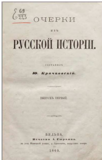
Малюнак 6. – Очерки из русской истории. Вильна, 1869

самабытнасці Беларусі як “Заходняй Русі (Расіі)”. Тэарэтычнае абгрунтаванне канцэпцыі заходнерусізму было дадзена Міхаілам Каяловічам у навуковых працах “Гісторыя рускай самасвядомасці” і “Лекцыі па гісторыі Заходняй Расіі”, якія былі ўключаны ў вучэбную праграму настаўніцкіх семінарыў. М.В. Каяловіч ідэнтыфікаваў беларускасць з праваслаўем і негатыўна ставіўся да польскага ідэалагічнага ўплыву на насельніцтва “заходніх губерній”. Беларускі патрыятызм тлумачыўся выключна праз прызму непарыўнага адзінства з Расіяй [8, с. 220]. Заходнерускае тлумачэнне беларускай гісторыі знайшло адлюстраванне і ў падручніку Ульяна Крачкоўскага “Очерки из русской истории” (малюнак 6), які быў выдадзены ў Вільні (1869): “Кромѣ одного названія – всё остальное здѣсь было Русское. При такомъ соприкосновеніи, сами Литовцы стали теперь дѣлаться Русскими” [9, с. 143].