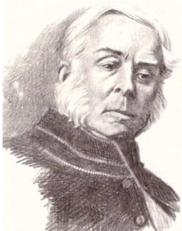
Малюнак 2. – Ігнацы Кулакоўскі

У 30-я гады XIX стагоддзя амаль паралельна з тэорыяй афіцыйнай народнасці фарміруецца гісторыка-ідэалагічная канцэпцыя, якая атрымала назву ўсходнеславянскага (=беларускага) літвінізму. У беларускім інтэлектуальным асяроддзі на аснове эвалюцыі русінацэнтрычнай канцэпцыі пачынае фармавацца новы вобраз Беларусі, узнікненне і станаўленне якога было звязана з новай інтэрпрэтацыяй гісторыі ВКЛ. Менавіта ў гэты час, як адзначае І.А. Марзалюк, узнікаюць радыкальныя варыянты прачытання гісторыі Літвы як гісторыі ўсходнеславянскай дзяржавы – Русі Літоўскай, у якой балцкая