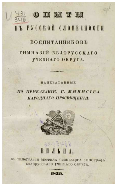
Малюнак 1. – Опыты в русской словесности. Вильна, 1839

с. 3]. Згодна тэорыі, беларускі народ не з’яўляецца гістарычным і дзяржаваўтваральным суб’ектам. Паводле А.І. Цвікевіча, “тэорыя афіцыйнай народнасці” стала асновай і першым этапам станаўлення гісторыка-ідэалагічнай канцэпцыі заходнерусізму [27, с. 13].