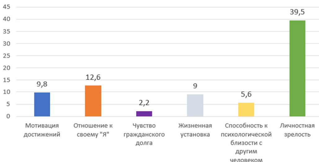
Рисунок 2 – Диаграмма средних значений по методике «Тест-опросник личностной зрелости» Ю. З. Гильбуха

На третьем этапе исследования был проведен корреляционный анализ переменных личностной зрелости и межличностной зависимости. Для определения взаимосвязи показателя «Эмоциональная опора на других» и показателей «Мотивация достижений», «Отношение к своему Я», «Жизненная установка» и «Личностная зрелость» использовался коэффициент ранговой корреляции Спирмена с использованием программы STATISTICA 8. Коэффициент рангов Спирмена позволяет определить тесноту (силу) и направление корреляционной связи между двумя признаками. Полученные результаты исследования представлены в таблице 1.