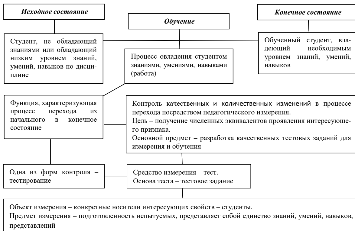
Рисунок. – Схема педагогической системы

Из схемы видно, что функцией, характеризующей переход из начального в конечное состояние, выступает педагогическое измерение, целью которого является получение численных эквивалентов проявления интересующего признака, а основным предметом – разработка качественных тестов для измерения, средством измерения – тест, основой теста – тестовое задание.