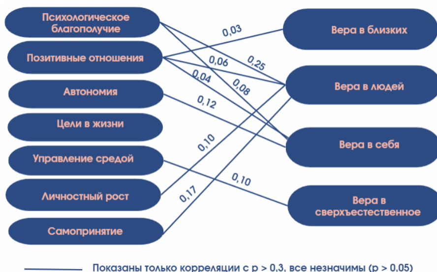
Рисунок 2. – Корреляционная плеяда взаимосвязи переменных психологического благополучия и веры (студенты других факультетов)

Далее для более детального изучения взаимосвязей между психологическим благополучием и верой у студентов гуманитарного и других факультетов был проведен факторный анализ. Использовался метод главных компонент с варимакс-вращением для выявления основных факторов, определяющих структуру этих переменных. В результате было выявлено три фактора, из которых один у студентов гуманитарного факультета и два у студентов других факультетов состоят из групп переменных с достаточно высокими оценками факторных нагрузок, включающих как компоненты психологического благополучия, так и веры.