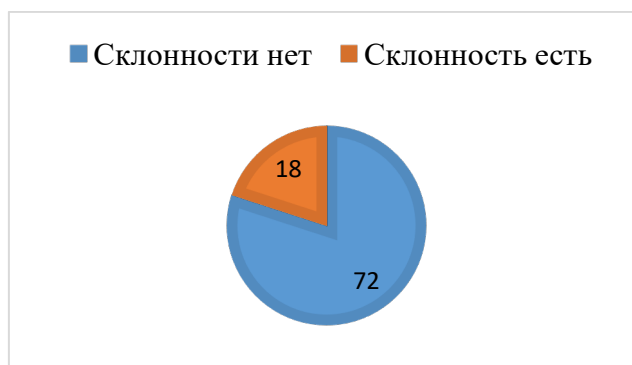
Рисунок 1. – Распределение респондентов по склонности к абьюзивному поведению (%)

Рассмотрим подробнее выраженность склонности к абьюзивному поведению, а также уровневые характеристики межличностного и внутриличностного эмоционального интеллекта и их аспектов у студентов.