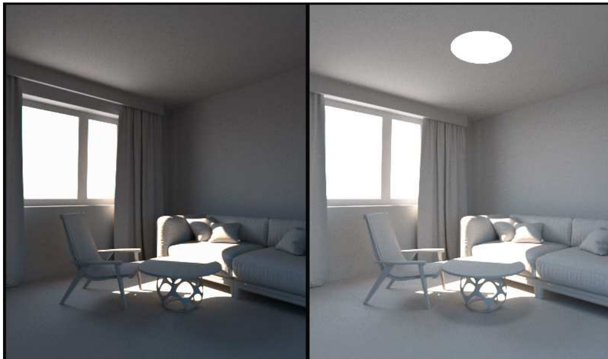
Рисунок 2. – Пример использования света для создания художественной ауры интерьера

По аналогии с архитектурой в дизайне интерьера можно условно выделить три основные составляющие: конструктивность, функциональность и красоту. Свет способен взаимодействовать с этими составляющими. На восприятие и эмоциональный отклик человека воздействуют такие универсалии, как форма, пространство, масса, цвет и свет. Если рассматривать свет не только с утилитарной точки зрения, а и художественные аспекты его распределения (контрасты, тени, блики, отражения), нетрудно прийти к выводу, что благодаря свету создается не только красивая и здоровая атмосфера среды, но и ее целостная, в определенной степени художественная форма (рис. 2).