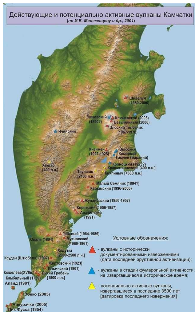
Рисунок 2. – Спутниковый снимок полуострова Камчатка. Вулканы Ключевской, Толбачинский, Карымский, Петропавловск-Камчатский, Гореловский [3]

Вулкан Карымский – один из активнейших вулканов Курило-Камчатского вулканического пояса. Он находится постоянно в стадии эксплозивной и эксплозивно-эффузивной активности (уже более 150 лет) и способен выбрасывать пепловые облака на высоту более 10–12 км. Его правильный конус высотой 1516 м над уровнем моря являет собой классическую форму стратовулкана, расположенного в центральной части кальдеры. Относительная высота конуса 600 м. Этот стратовулкан андезидацитового состава изливает на поверхность не свойственные этому составу относительно подвижные глыбовые лавовые потоки. [4]