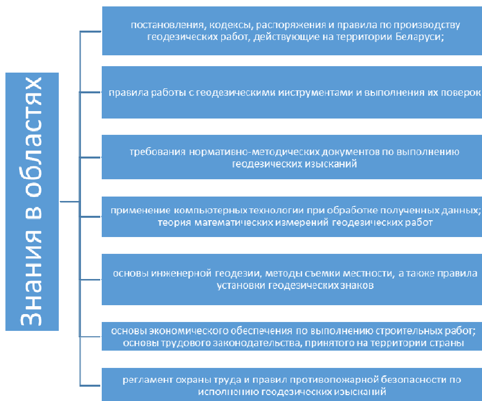
Рисунок 3. – Требования к знаниям и умениям