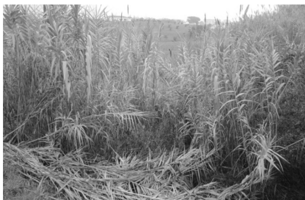
Рисунок 1. – Арундо тростниковый (г. Лерия, Португалия)

Материалы и методы. Исходным структурообразующим компонентом для утеплителя являются частицы из измельченного стебля арундо тростникового (тростника гигантского). Ареол распространения относится к южным регионам Европы (на Юге Португалии, Испании, Франции), а также Турции (рис. 1). Предварительно полые стволы свежесрезанного тростника нарезали на цилиндры длиной 30 - 50 мм, а затем измельчали в шаровой мельнице, высушивали и фракционировали. Для изготовления образцов использовали частицы тростника длиной 10 - 30 мм с размером поперечного сечения от 0,25 до 2,0 мм.