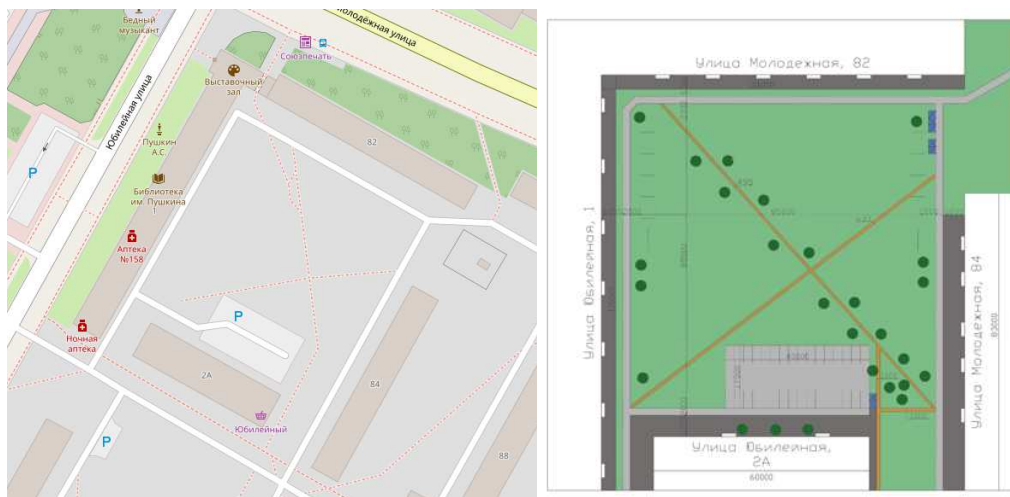
Рисунок 1. – Опорный план территории

Далее, для наибольшей наглядности, будет проведен анализ одного из дворовых пространств города Новополоцка, расположенного на пересечении улиц Молодежная и Юбилейная (рис. 1.).