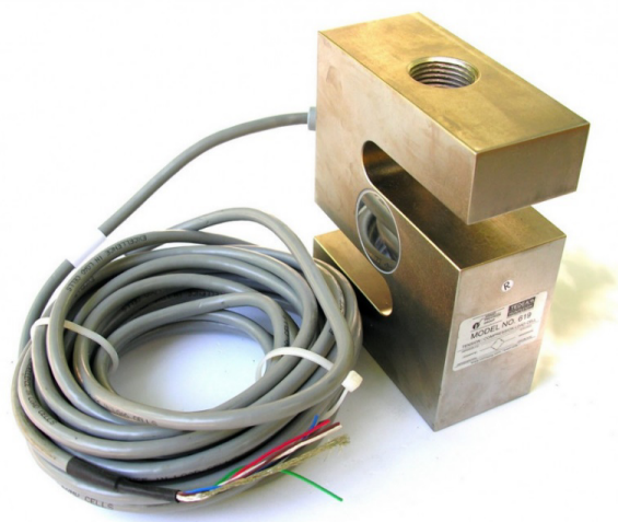
Рисунок 2. – S-образный тензометрический датчик

Как правило, для глубинных датчиков используется именно линейный тип типоразмеров, которые измеряют деформации только в одном направлении. Тензометрический датчик – это прибор, который реагирует на изменения в структуре бетона. На территории СНГ существуют различные тензометрические датчики, разных форм, как правило и разных размеров. Так же тензометрические датчики бывают разные по назначению. Зачастую они представляют собой шарообразную форму или форму прямоугольных пластин, хотя встречаются и необычных размеров, например, S-образные (рисунок 2) [4].