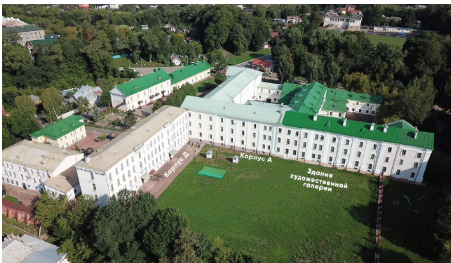
Рисунок 1. – Корпуса коллегиума и внутренний двор университета

Восстановление корпусов заняло долгие годы. Сегодня практически все здания подняты из руин, реконструированы и отреставрированы. Кроме того, во внутреннем дворе сделаны музыкальные часы с академическим шествием, восстановили колодец. В одной из аудиторий коллегиума появилась реконструкция проекта Габриэля Грубера «Механическая голова,» создан арт-проект «Изобразительное искусство в истории Полоцкого коллегиума». Корпуса функционируют, в них учатся студенты и их посещают туристы, что нельзя сказать о территориях, прилегающих к комплексу. В свое время на отдельных из них высились культовые здания и находились цветущие сады (рисунок 1) [4].