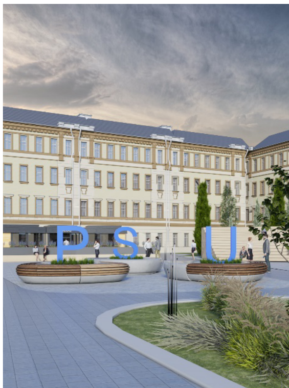
Рисунок 3. – Перспективное изображение зоны активного отдыха

Именно в тихой зоне отдыха планируется поместить объекты, которые помогут сохранить уникальные культурные особенности древней Полоцкой земли, истории Полоцка и коллегиума, доставшиеся нам от предков, что является весьма актуальным во все времена и особенно в год Исторической памяти Беларуси. А вот в активной зоне планируется выставить арт-объекты в виде аббревиатуры названия Полоцкого государственного университета имени Евфросинии Полоцкой, выполненные в виде металлических букв, расположенных на приподнятых газонах, которые служат визуальными акцентами в пространстве двора (рисунок 3).