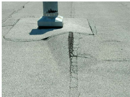
Рисунок 3. – Вздутие кровельного ковра с нарушением герметичности

По технологии ООО «ТехноНИКОЛЬ-Строительные Системы» [5] ремонт вздутий между слоями кровельного ковра выполняется следующим образом. Вначале освобождают кровельный ковер от защитного слоя или крупнозернистой посыпки на ширину 20 см на участке предполагаемого разреза вздувшейся части, затем делают крестообразный разрез вздувшихся слоев кровельного ковра и отгибают их в сторону. Находят складки, по которым вода поступает к местам вздутия, разрезают их и отгибают в стороны; вскрытую поверхность рулонного ковра (под вздутием и складками) высушивают, очищают от пыли и покрывают холодной или горячей кровельной мастикой. При применении горячей мастики вскрытую поверхность грунтуют, отогнутые части вздувшихся полотнищ (а в необходимых случаях и ведущих к ним складок) сразу же укладывают на кровельную мастику и прижимают от краев к разрезу. По местам разреза слоев кровельного ковра наклеивают полосу из рулонных материалов шириной 15 – 20 см и восстанавливают защитный слой в этих местах, а также на участках возможного повреждения на изгибах. Ремонтировать воздушные мешки можно и более простым способом. Необходимо проколоть вздутие, выпустить воздух и ввести в полость растворитель (уайт-спирит, керосин), после чего уплотнить ремонтируемый участок.