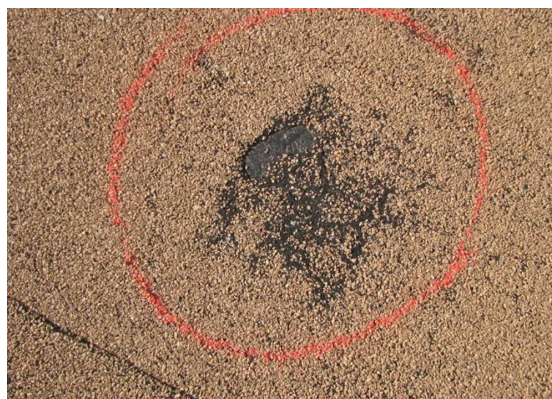
Рисунок 2. – Отсутствие защитной посыпки над вздутием

Если вздутие приближается к диаметру около 0,6 м, рекомендуется отметить его внешней границей, и периодически проверять размер, чтобы определить, не увеличивается ли он. Когда размеры вздутий достигают 1,5 м или они возникают в местах с интенсивным хождением, вздутия следует ремонтировать. Если вздутие разорвано и не герметично, процесс ремонта заключается в удалении всей приподнятой части кровельного ковра и заполнении пустоты последовательным нанесением новых слоев рулонного материала. В качестве альтернативы на вздутие может быть сделан надрез в виде буквы «Х», углы разреза отгибают, образовавшуюся полость очищают, обрабатывают праймером, приклеивают заплатку, далее углы надреза отгибают и приклеивают к заплатке. Затем поврежденную зону усиливают дополнительным верхним слоем кровельного материала.