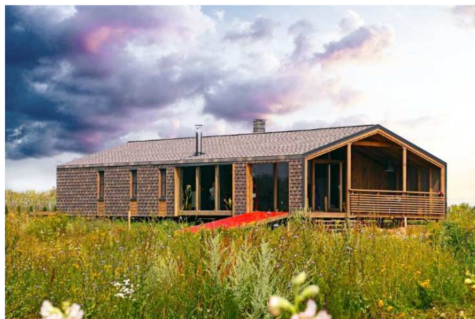
Рисунок 1. – Проект «Дубльдом 87» компании Dubldom