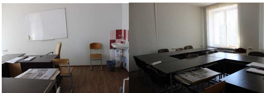
Рисунок 3. – Мастерская для занятий графикой и макетирования

Специфическим помещением является мастерская для занятий графикой и макетирования и делится на три зоны: санитарная, рабочая, зона преподавателя. Санитарная зона отделена от других зон яркой акцентной плиткой. Рабочая зона и зона преподавания имеют общий тёмный колорит орехового дерева. Пол имеет покрытие линолеума под текстуру светлого дерева (рис.3).