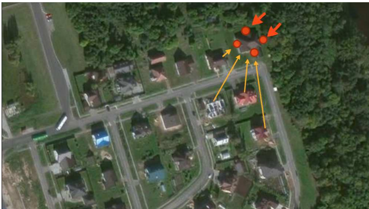
Рисунок 2. – Анализ дома на периферии застройки по улице Полевая

На рисунке 2 представлен анализ жилого дома, находящегося в отдалении на периферии территории.