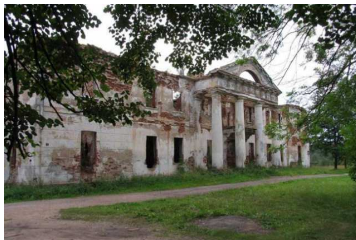
Рисунок 2. – Современное состояние усадьбы Гребницких

Нынешний печальный облик усадьба получила после сильного пожара, который произошел во второй половине 1990-х годов (Рис. 2). Неизвестно доподлинно, произошел ли пожар случайно или это был намеренный поджог.