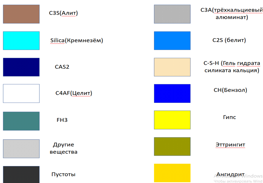
Рисунок 2. – Условные обозначения структурных элементов в программе VCSTL

В качестве основного вывода можно заключить, что задача структурно-имитационного моделирования элементов цементного композита является комплексной и требует тщательного изучения на каждом из этапов моделирования матрицы, заполнителя и пор. А именно: на этапе создания их геометрии и ориентации элементов в пространстве и назначения эффективных свойств, на этапе закрепления созданной модели и ее нагружения. Знание того, какой вклад вносит отдельная фаза при различных вариациях технологических факторов в макросвойства материала, дает новое понимание результатов экспериментальных исследований