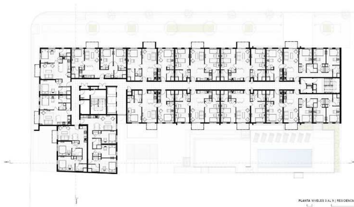
Рисунок 2. – План типового этажа

Для горизонтальной коммуникации между жилыми ячейками общежитий чаще всего используется коридор, однако есть и проекты, где используются галереи и верхний свет. При этом, как правило, на нижнем уровне находится общее пространство, которое может сочетать в себе несколько функций. Здание, построенное по проекту Vêtania [3] от архитектурного бюро atelier OBJETIFS во Вьетнаме, рассчитано на проживание 78 человек. Внутри расположена библиотека и малобюджетный ресторан. Жилые комнаты связаны галереями, выходящими во внутреннее пространство, в котором расположено дерево и фонтан, улучшающие микроклимат в здании. Конструкция здания делает возможным сбор дождевой воды, которая используется для подпитки фонтана и других нужд. Фасад выполнен из бетона и представляет собой треугольную сетку, скрывающую внутренние помещения от посторонних глаз.