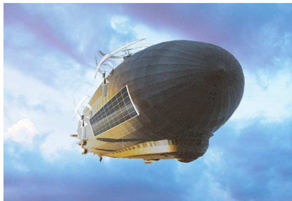
Рисунок 1. – Общий вид ТНА-дирижабля (образное решение)

В настоящем исследовании рассматривается как ТНА-дирижабль сам по себе, так и вся система «ТНА-дирижабль и соответствующая инфраструктура». Одно из эскизных образных изображений ТНА-дирижабля представлено на рисунке 1.